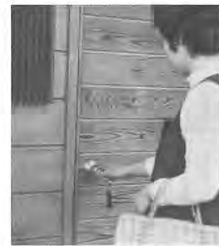
外出する時は必ずカギをかけて