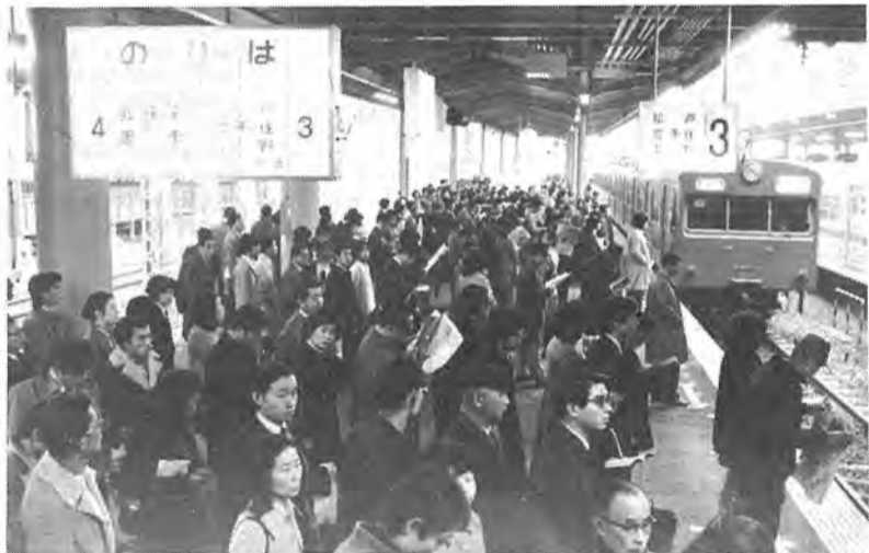
皆さんが待ち望んでいた快速電車の柏駅停車は10月2日から実現。都心への距離も縮まって通勤通学者に大変喜ばれています。また商圏も広がり市勢の飛躍的発展が期待されています。