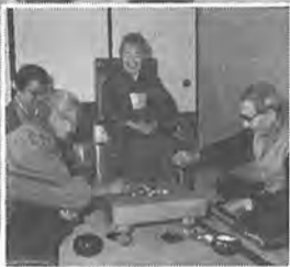
第二の人生が豊かに送れるようにと四月に始まった豊四季老人いこの家。ここでは老人がみんなといっしょに生きる意欲と喜びをもつ場になっているようです。