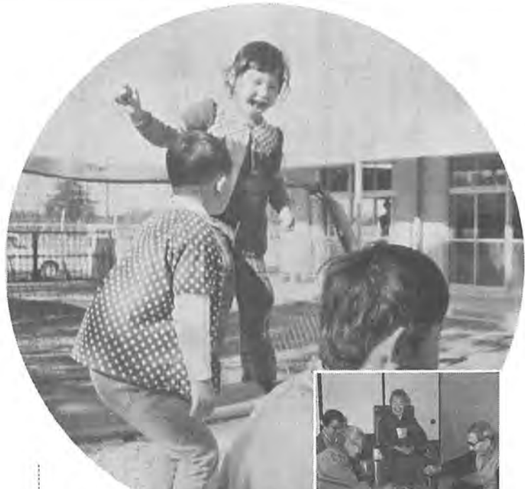
はばたけ園児 4月から開園した精神薄弱児施設十余二学園では、27名が元気に通園、ひとり立ちするのに必要な知識と技能を学んでいます。