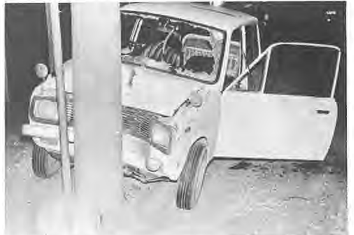
ちょっとした不注意がとりかえしのつかない事故を引き起こします