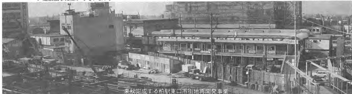
来秋完成する柏駅東口市街地再開発事業