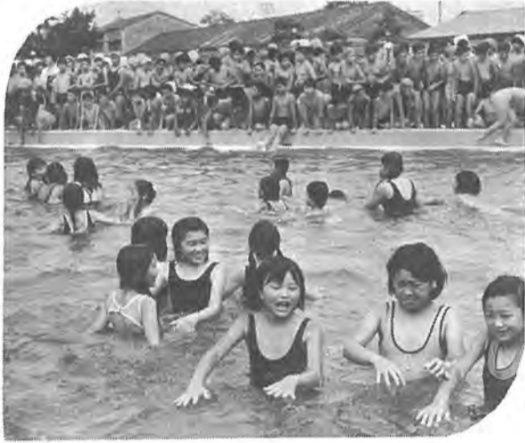
プールが六つ (写真)は柏三小プール