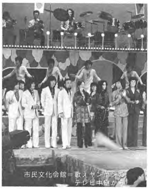
市民文化会館＝歌えヤンヤンのテレビ中継から