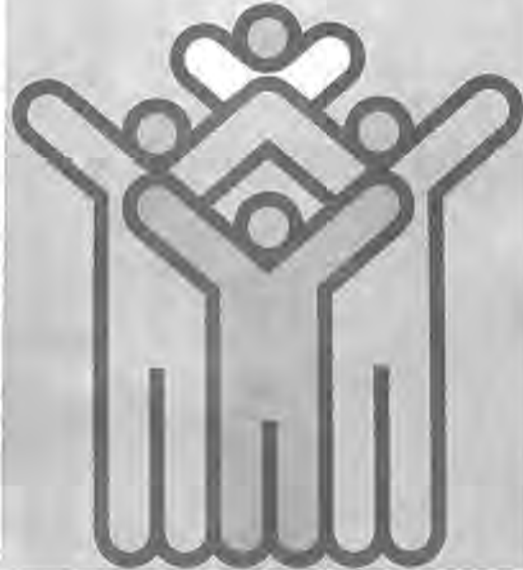
ポスターが棄権防止を呼びかけています

投票所を光中に 酒井根などの一部 有権者の増加に伴い、いままでも第二十二投票区(投票所)柏市婦人児童センターとしてあった次の地区は、第二十八投票区(投票所)光ヶ丘中学校になりました。お間違のないようにしてください。 ○光ヶ丘 一七八二 ○酒井根 八六七九三三 ○中原 一七八七〇一七八九・一七九三三・一八一二・一八三三・一七八八・一八八二・一八八七