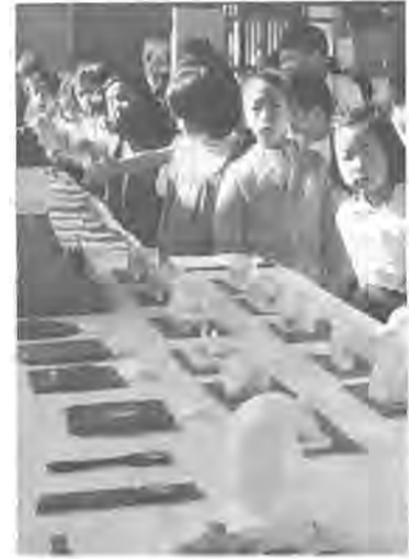
多くの作品はどれかな？ すうりならんだよい子の苦勞作

全教育で知事さんから表彰されました。中学校では数少ない交通安全教育研究校としておとしに指定を受けて三年目、今まで交通事故はゼロです。 富勢中の学区には、6号線と16号線が通り、車の多い所で指定される前は毎年二・三件の事故があり、「このままではまづい」と生徒会も交通安全委員会をつくりました。校内には、信号やふみ切りもある本物そっくりの「道路」があり、生徒はこれを、信号に従って登校しています。 この道路の建設には、お父さんお母さんがたの勤勞奉仕や、地元の人による模しきやポールの無料提供がありました。また、ふみ切りは、我孫子保護区のおじさんがつくってくれまし