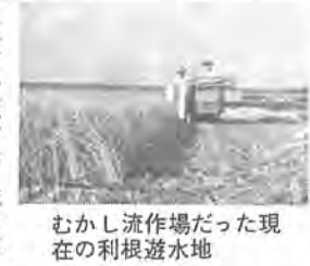
現在の流作場だった利根川水地

利根川の出水は必ずといってよいほど流作場に大きな被害を及ぼす。彼も父の遺志をついで流作場の改良に奔走しますが時代は経ても農民の保守的な考えは変わることなく月日のながつ