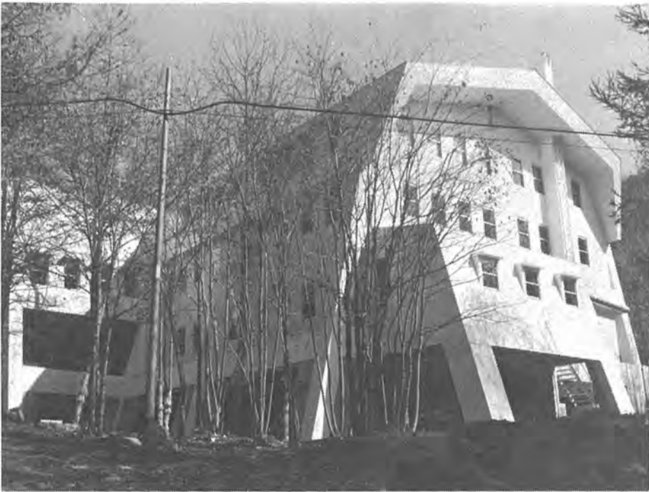
山あい近代的な感覚を取り入れた「かしわ荘」

菅平高原のほんの少し下、山あいにこまれた静寂な地に建設していた柏市民の保養施設「菅平かしわ荘」がこのほど完成し、いよいよ十二月一日にオープンします。建物は市役所の約五分の一、市民文化会館の約半分、千四百七十七平方メートルの規模です。すぐ前に八平方メートルの規模をめぐって大明神が流れキャンプをするには絶好の場所といえます。ここで働く職員十名のうち八名が地元出身者となっており、信州の「情」が皆さんにあたたくおむかえします。