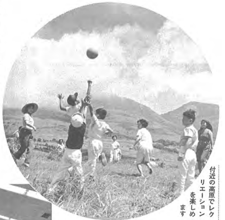
付近の高原でレクリエーションを楽しめます

過密、騒音の都会を離れて、一日でいからノンビリと過ごしてみたい。そんなかたは、ぜひ「菅平かしわ荘」へお出かけください。まばゆいばかりの太陽、本当にぬけるような青い空、甘く澄んだ空気、目を奪う高原植物、時の流れを変えてしまふほどの静寂、大きな自然のふところ、心ゆくまで自然との対話を楽しんでください。