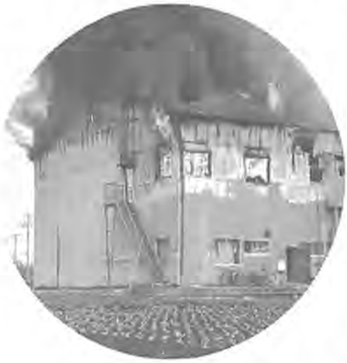
ちよとした不注意が大きな火災をひき起こします

十一月という菊花の季節である。この季節は、全国でも文化の日を中心として各所で催し物が行なわれ、色とりど