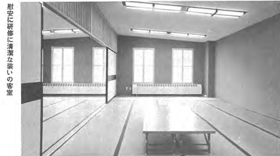
慰安に研修に清潔な装いの客室

15km 38.5km 32.5km 43km 41km 18km 35km 柏=野田=栗橋=熊ヶ谷=高崎=軽井沢=小諸=かしわ荘