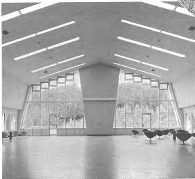
いろいろな催しに利用できる大ホール