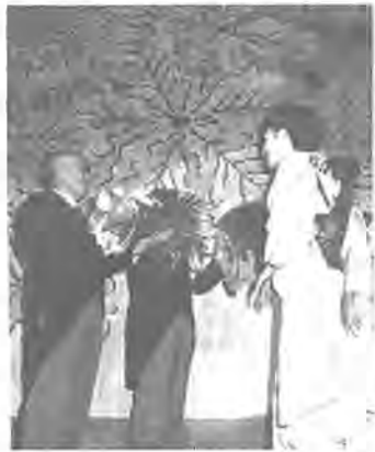
市長から選ばれた市民から優良事業にあたる市から文化建設に貢献した花束が贈られました。

十月二十七日市民文化会館落成記念式。昨夜の雨のせいにか、雄都市にふさわしい市民文化会館ができてきました。この上は市民の文化、芸術などの精神的なしをみせ、定刻の十時には喜びもみせはじめました。 お客様には町会から代表の行政連絡員、市議会議員、関係関係者近隣市町村の代表者、どんねの「柏」の下絵を担当された聖山雨風さん(代理)や用地を提供された地主さんなど三百余人が出席。柏