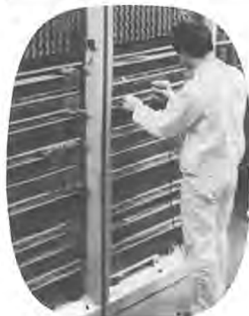
19日から田中地区の通話を処理する自動交換機

田中電話交換局が、このほど花野井七四六番地先に新設され、今月十九日(水)午後三時から開局します。 この開局で、市北部に約二千二百台の電話がとりつけられることになり、通信施設の不足が解消されて地域の発展に力を発揮することになります。 なお、市北部地域の電話は、新局へ収容されるため、電話番号が変わりますのでご利用する場合は注意してください。 ○変更地域 布施・宿連寺・大青田・柏戸の全部と千余二・根戸の一部