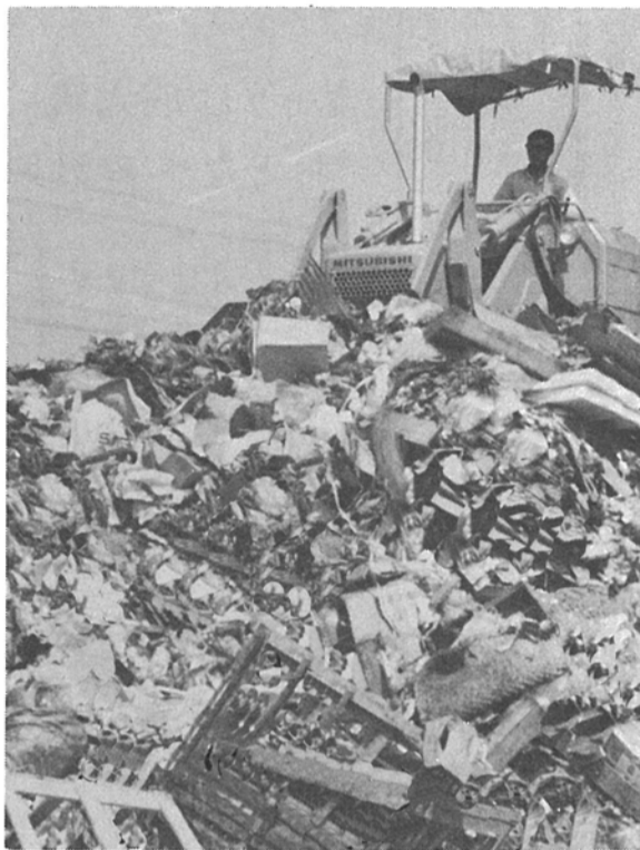
山のように積まれたゴミを埋め立てる作業員

みなさんのご家庭から出るゴミ類は、きめられた集積場に出すと、耳なれたチャイムの音とともに収集されるようになっていきました。市のゴミ処理活動は、ここが出発点です。大量生産、大量消費時代、使い捨て時代を反映して、ゴミの量は増大する一方です。質においても多様化しています。 そこで今号では、市民のみなさんの快適な生活環境を守っていく、一番身近なゴミ処理状況を紹介します。