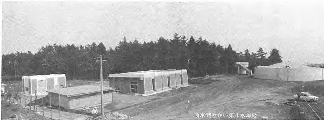
通水間近かい第4水源地

今年も「水」の恋しい季節となりましたが、きょうから七日まで、全国一斉に水道週間が始まります。 この週間の目的は、日頃なげなく使用している水をあらためて考えなおし、私達の生活に欠かせない水を大切に上手に使うとするものです。この機会に柏市水道をみなさんに知っていただくために、「水」のあらましを、写真を入れてご紹介いたします。