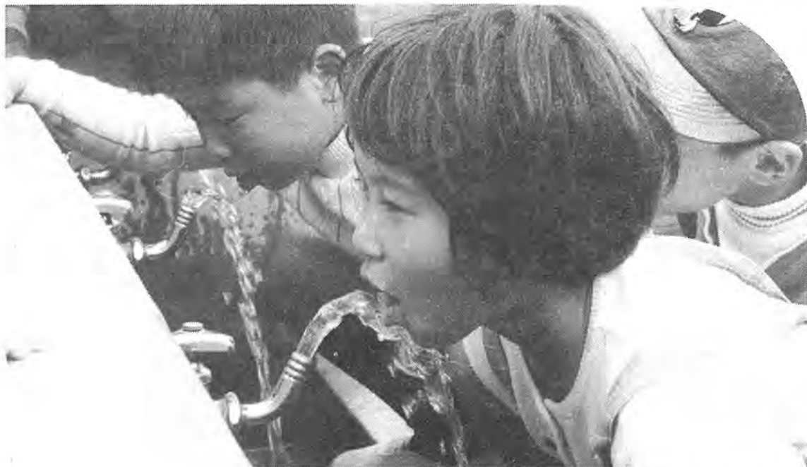
▲ こうしてお届けした水は、みなさんの生活にはかり知れない役目を果たしています。