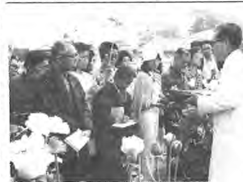
第3回自然科学講座が去る5月20日、ケンの花満開の春日部国立薬草園と浦和市にある野田さぎ山で行なわれまし

老齢、障害、母子などの福祉年金を受けている人は、毎年六月に前年の所得状況を届け出ることになっています。