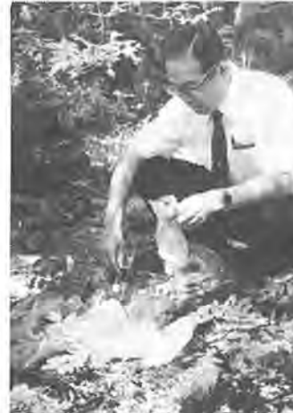
シンナー遊びの現場、ここでも少年の体や心がむしばまれた

このところ、補導センターの宗村主査は「補導数は延数なので、昨年同様では三名となっており、今年七月は、全く驚く数字であることが分ります。シンナー遊びの恐ろしさは、すぐにはよく知られていますが、シンナーやボンドに含まれている薬品が、慢性中毒になると貧血状態をおこしたり、肺やじん臓、心臓などをおかし、頭痛、めまいなどの症状が出て、常用すると脳と同様の状態になります。 この少年たちが、学校の先輩や後輩に誘われて、遊びに来たところから、急激にふえたシンナー遊びの補導例、七月には二十七名に