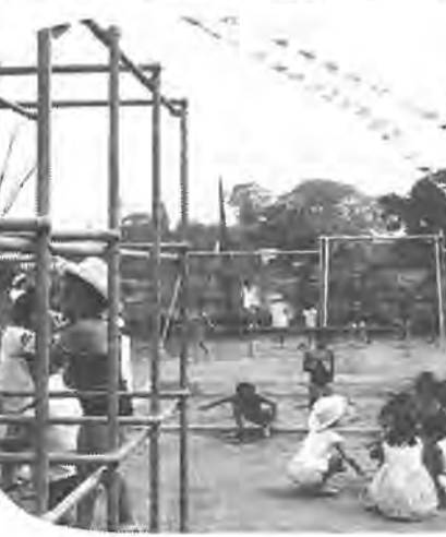
でき上がった遊園地で元気に遊ぶよい子

市街地開発調査にご協力を 千葉県土木部では、八月二十日から十一月三十一日までの約四ヶ月間にわたり、豊町・南柏・谷上・豊田・富里町の各一部で、市街地開発調査を実施することになりました。 最近人口の都市集中の著しい中で、特に首都圏近郊部内帯内帯の東京湾沿いや東葛地域は、全国的にも著しい人口急増地域となっており、このため、市街地周辺の農地や山林が無秩序に宅地化され道路、公園、学校、交通機関など都市施設の不備による都市問題が各地でひき起こされています。 今回の調査は、これらの問題を未然に防ぎ、住みよい市街地を造成するため、あらかじめ現状を調査し、市街地としての整備計画を樹てようとするものです。 調査は、調査区域内の現状を把握し、市街地の方向を見通して適に誕生しました。 この遊び場は、光ヶ丘五十五歩一七八二にあり、京成電鉄株式会社から市へ無償提供された面積約四百六十八平方メートル、総費八十三万円をかけて建設されたものであります。 ここには、ブランコやスベリ台ジャンケルジムなど、よい子が安全に楽しく遊べる遊具が揃っています。 またこの遊び場に隣接して中原町会のみなさんがつくった幼児用のプールもあり、夏休み中の子どものための楽園になることましよう。