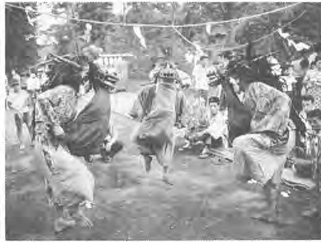
境内での獅子舞、リズムに合わせて大きな頭がゆれる

豊四季団地の近く、篠籠田に西光院というお寺があり、毎年八月十六日三時頃から同寺院境内で三匹獅子舞が行なわれます。 この行事は、約二百八十年前の元禄時代、徳川五代將軍綱吉の頃から伝えられたといわれており、一種の雨乞いの行事として豊作を願う農民の素朴な心をうつして代々伝承されてきたものです。 獅子舞は獅子、ひよっこ、きつね、獅子方が続きます。 境内での踊りは、雄雄三頭の獅子舞を中心として花笠をもち、花笠若者がおり、獅子は花笠にたわむれたり、ひよっこ、きつね、さいわいなど、現在ではおびしや祭の習慣も破られてきているようでおびしや祭は単調なリズムで、獅子の調子、獅子頭等はすべて口伝として伝承されており獅子頭は長男、二番子、三番子が踊ります。