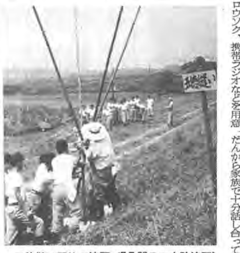
五徳縫い工法の演習(7月28日の水防演習)

停電に備え 懐中電灯や携帯ラジオの用意も 最近では、気象科学技術の発達によって、従来のように正確に台風の進路や風向き、雨量などの状況を予測できるようになりました。したがって、各家庭では台風警報に注意して、台風の進路に当たることが予想されたら、家の回りの樹木や塀などが風圧で倒れないように補修しておくべきです。