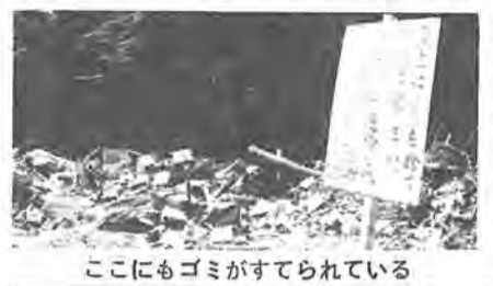
ここにもゴミがすてられている

市で行なっているゴミの収集は「定時収集方式」といって、決められた日に、決められた場所へ収集車が回って集めていますが、この収集日以外に、ゴミを紙袋やビニール袋に入れて出してあるものが見受けられます。 このように、ほうつておかれると、今のうちに悪い時期ではなく、腐敗するだけでなく、犬や猫が食いついて、不衛生になり、近所に迷惑をかけるので、必ず収集時間にポリバケツへ入れ、よく蓋をして、回収されたらすぐ持ち帰りましょう。 また、残飯や野菜はよく水を切ってすててください。この際、容器の底に紙を敷いておくときれいにとれます。かさばる紙箱などは折たたき、枝木は五センチ位に切つてまとめてください。ガラス類や空き缶は、別に包んでその都度出してください。