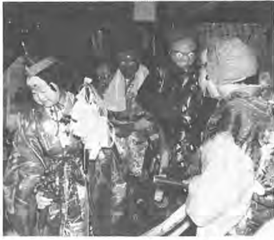
天の岩戸の故事にならうおかめの踊り

船戸にある天王寺で正月二十日に行なわれる「おびしや祭」は約三百年前の元和年間から伝わり、その年の豊作を祈るために行なわれる村人の行事です。 「おびしや祭」というのは、正月間東地方で広く行なわれている行事で、部落の講中が組や講ごとに分かれ、当番の家を訪れて酒食の供進を受け、正月の楽しい催しです。本来「びしや」というのは弓を射ることを意味するもので、正月初頭の弓の神事をいいたのですが、神事の方が次第に廃れ、会食だけ残ったものです。 この天王寺のびしや祭も、そのひとつですが、酒食の供進だけでなく、舞いや獅子が加わり、部落の正月を飾る、楽しい「お祭り」になっています。