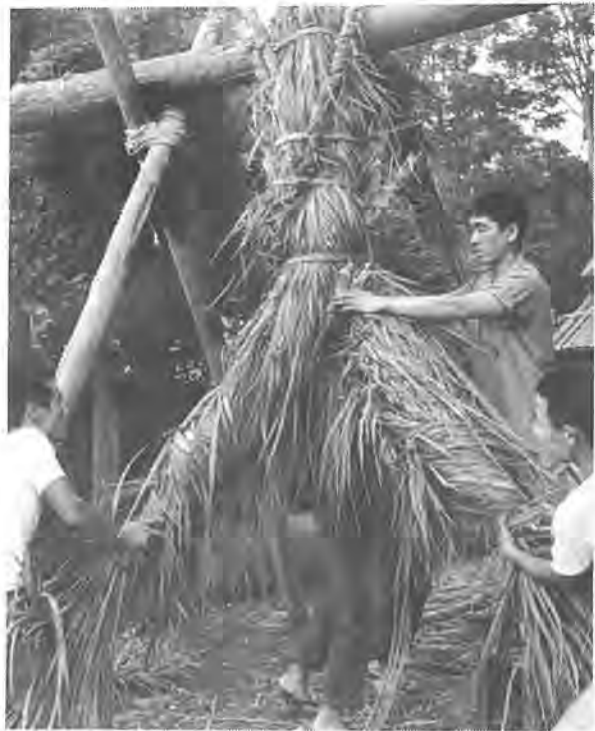
当日午前 8 時 30 分から綱をゆい始める、元綱にささを巻きこんで 60cm から 1m に仕上げる。

盆綱の起因は神代の昔、天照大御神のころからの力綱であるといわれ、市内大室地区で行なわれる盆綱は、元禄十二年七月十三日(六ツ)午後六時)を合図に綱引きが開始され、その年の吉凶を判定したといわれています。 近年では八月十五日の夜九時頃、拍子木の合図とともに綱引きが始められます。この綱引きの綱は朝の八時三十分から十時頃の風乾き(盆綱)は、柏原西口から野田方面の荒瀬敷本を寄り合わせた「大室」で下車元綱に、その年の引手数によって、徒歩で約十分位です。