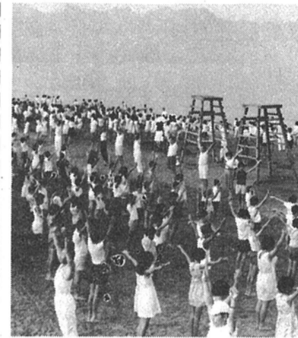
楽しい臨海学校の朝(岩井海岸で)

今年の四月からの小・中学生の交通事故をみると、四月七件、五月五件、六月六件となっており、死亡事故も一件起きています。この原因の八割から九割までは、左右不確認と、とび出しによる事故です。 夏休み期間中は、暑さでとかく気がゆるみ勝ちになり、また気配に戸外に出る機会も多いので、交通安全には十分留意し、出かける前に必ず安全についての注意を身に付けてください。 また、子どもたちだけで外出する機会が多くなるので、行先、一緒にいく友人の名前、帰宅時間を確認してください。 子どもたちは、とかく水辺に近寄りたがり、利根川、運河、手賀沼は水泳禁止区域として指定されていますので、絶対に泳がないように注意してください。