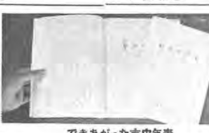
できあがった市史年表

訂正 五月十五日「第一回臨時市議会」の記事中、市税条例の一部改正についての中に、「障害者、老年者、寡婦、勤労学生の特典限度額が三万円から三十二万円に引上げられた」とありましたが、勤労学生については従来どおりです。お詫言ひして訂正します。