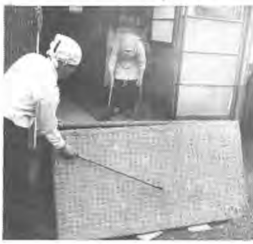
ふだんできない場所も大掃除の機会に

春は、衛生害虫が活動し始める時です。この季節は大掃除をして害虫を退治するのに、大変効果的です。 清潔で気持ちよい生活を送るために各家庭が次の定められた期間に、一斉に大掃除をするようにご協力ください。 市では、大掃除の後の薬剤散布(床下消毒)も計画していますので、町会などの地域ぐるみの組織活動としてぜひ実施してください。