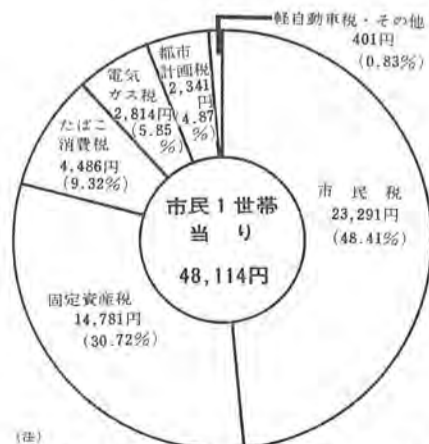
数字はS45. 4. 1現在の世帯数(38,456)から算出したものです。

これは上水道設計計画の第二次(目標年度昭和五十年)に当り、急増する南部地域の備用に対するため、第四水源池を南増尾に新設第三水源池の施設拡充などがあるためです。