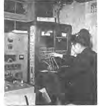
お知らせや通話に十二年間親しまれた有線放送交換台(上)と有線電話(右)