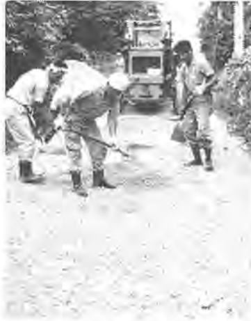
進められる道路整備

一般会計予算の二十五%、十二億一千四百万円を計上した土木費は、道路の新設改良、都市計画街路の整備、都市改造、土地区画整理など都市づくりの骨組みを作るために使われます。