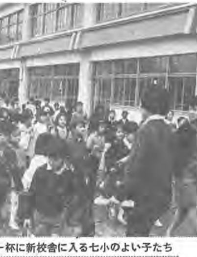
希望を胸一杯に新校舎に入る七小のよい子たち

マイクロスコープを市内を案内するある市民教室の五月会員を次のとおり募集します。 今回は、五月十八日(月)南回りコースで行なう予定で費用は一切無料です。 参加を希望する方は、五月五日までに往復ハガキで柏市五丁目十番一号市役所市長公室広報課へお申し込みください。 死した時、友引などいらいらな理由で煙火葬するときまで遺体を安置しておけない人は、安置室の使用について柏市役所内事務組合事務局(67-1-1内線二八五)へお申し込みください。 なお使用料金は、一体一日につき組合員区域居住者は五百円、区域外居住者は千円です。