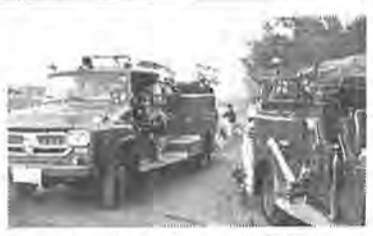
きびんに活動する消防車

保健体育では、総合運動場の維持管理のほか、新たに西口地区に二十五米プールと徒渉プールの建設費四千四百万円を計上し、また児童生徒の健康管理に必要な経費、学校給食の充実と整備を進める経費など、総額一億四千万円を計上しました。