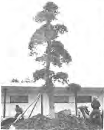
管理棟に植えられる県の木

は、目通りが八十五センチ、樹高五・五米と 昨年七月に開場した総合グラウンドは、市民の体育センターとして利用されていますが、この種開設を記念して千葉県から、県の木「マキ」が贈られました。このマキ