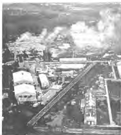
将来柏市産業の中核ともなる十余二工業団地

また、従業者数は八千八百九十四人で、食料品製造業従業者が一番多く、次いで金属製品、機械器具の順となりますが、事業所当たりの平均では、食品製品の九十五人、電気機械製品の七十九人、鉄鋼製品の五十九人となり、業種別の平均規模はほぼ均等です。