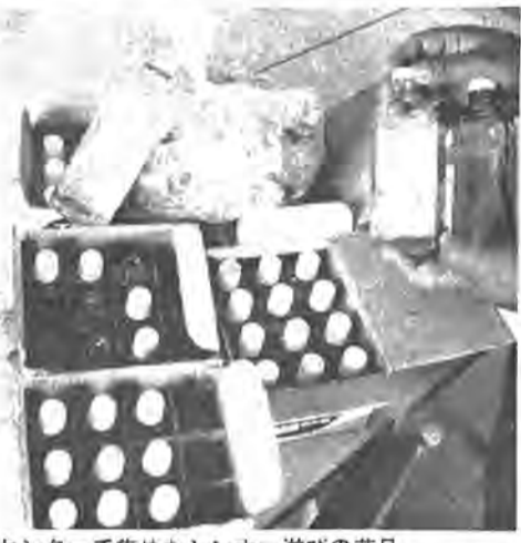
センターで集めたシンナーを薬品として大規模に買入るケース

昨年六月から柏市に「浸入」を始めたシンナー遊びは、センター及び警察の両者を合わせて百八十八名の補導少年を出しています。この数は、県下各警察管内で三番目という「不名誉」なもので、今年一月には死亡事故もみおこしています。この遊びで補導された少年の種別は、職を持つ者三十四・五％、高校生三十一％、無職少年二十・六％となり、年令別では十六歳、十七歳、十八歳という順になり、ここでも高校生や無職少年が、七位に躍り出しています。この遊びは、体を衰弱させるだけでなく、心までもむしばみ少年を違法行為にまで走らせたり、死傷させる危険があります。死のゲームをするようになっていまい。センターでは、成人であつても現病を発見次第警察と協力して厳しい注意を与えています。なかなか根絶できません。成人者だといって、この遊びの