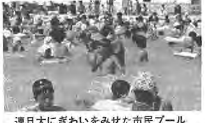
連日大にぎわいをみせた市民プール