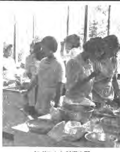
にぎやかな料理実習

五月一日に開館した勤労青少年ホーム(柏市根戸、バス布留入口下車五分、富勢中学校隣)では、勤らく若い皆さんに、休日や余暇を楽しく過ごしていただくため、お料理やお茶の講座を開催しています。 使用申込は、ホームで直接受付、簡単な手紙などで利用できます。開館時間は、平日午後一時から九時、土曜日は午後二時から四時、日曜日は午後三時から五時です。