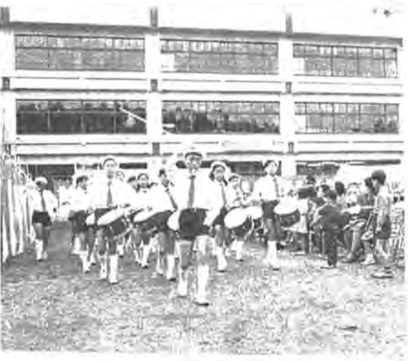
開校祝賀式の様子

五月二十九日には、土南部小の誕生を祝う開校祝賀式が行なわれ、これで行内の小学校は十二校となり、着実に進められている教育環境整備が、またひとつ大きな足跡を残しました。 南部小は、四月に百九名の新生を迎え、これに十名ほどを加えていた児童三百三十四名を加えて十二学級で四月八日から開校して以来、一万七千六百六十五平方メートルの敷地に、総工費一億三千七百七十九万三千円で建設されました。 当日は、開校おめでとうと書いた下駄が、市長から全校生徒に贈られ、鼓隊の演奏やお母さん方のホークダンスなどで、開校を祝う楽しい一日を過ごしました。