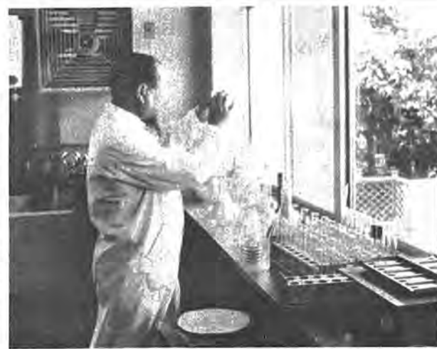
伝染病流行期を前に細菌検査に余念がない柏保健所員

では伝染病の病原菌はどのようなルートを経て人体をむしばむのでしょうか、赤痢を始めこの時期に多い伝染病を予防する運動を、家庭から先ず起こしましょう。 ▼赤痢・疫痢 寒気、頭痛が伴ない、三九度近い高熱が出る。同時に、腹痛を感じ、おう吐、下痢をし、便には粘液血や膿もまじります。 疫痢の場合には元気に遊んでいた子供が急にぐったり食欲不振、ころころと嘔吐に寝こんでいく。くびを連発、暫く続いたら四十度近い熱を出し、気がなまってひきつけを起こすことが多いようです。 ▼日本脳炎 患者、保病者の密着した赤痢菌を、ハエ、ゴキブリが運び飲料水、食物に付着させたものを飲食した場合に感染します。 ▼予防 用便後、食事前によく手を洗い、暴飲暴食をしないようにします。 発熱、下痢、腹痛の症状があるときは早く医師の診断を受けて、素人療法は絶対によめましょう。 ▼日本脳炎 急に寒け、ふるえとともに四十度近くの高熱がでます。 激しい頭痛、めまい、おう吐とともに頭部の筋肉が硬くなり興奮して頭や手足を動かしてあげれば四・五日すると静かになります。い状態から無意識状態に陥ります。後遺症として手足の麻痺、知能