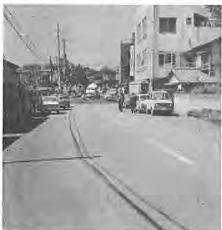
整備される都市計画街路—東谷台向中原線—(手前は施工済)