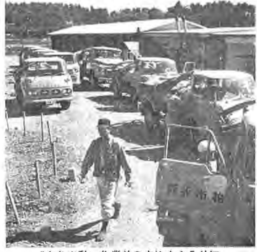
「さあ出動。作業前の点検も念入りに