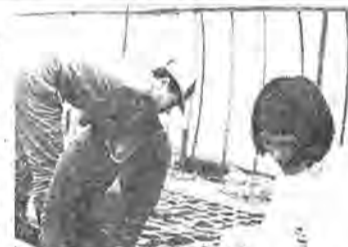
この技術を郷土の農業に(十数張ケ谷さん宅でキュウリの苗床作り)

沖繩の南部農林高等学校では、毎年三月になると、本市の農家を訪れ、農業技術や経営などの実習に訪れて、郷土の農業振興をはかる手がかりにしています。