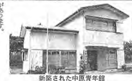
新築された中原青年館

先生 うん、そういう場合でも当時の借地契約ではよく、後で問題が出たとき、借地契約の問題が単なる借地契約でなく、借地法による保護を受けられない場合もあるね。 Qちゃん そうなんです、借地法による保護を受けられない借地契約は、借地法の適用範囲外の場合が多いですね。 先生 そうだね、その中で借地法による保護を受けられない借地契約は、借地法による保護を受けられない借地契約は、借地法の適用範囲外の場合が多いですね。