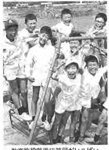
教育施設整備に笑顔がいっぱい

昭和四十三年第一回定例会を迎えるにあたり、新年における市政執行について所信の端を申し上げ、今後における各行政の推進に協力をお願いいたします。 さて、さるる年末をもって本市人口も十二万八千を越え、県北の極東都市として着々とその地位を築きつつあることは、これほどとて、市民各位の協力に、