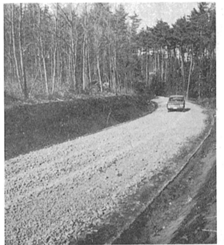
一部新設なった小新山線

また、新設線として計画されていた小新山線の一部中員八米、延長三百九十一米が竣工しました。これは、南部地区の小新山、新栄町などの住宅地と、東守谷、流山線とつながるもので、この地区は、従来松戸市方面を迂回して東守谷市では、こうした幹線となる市道の新設や改修のほか、毎週火曜日に定期的な道路状況チェックをトローリングしており、補修や維持管理に努めています。道路は、私たちの生活はよく