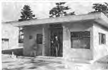
新装なった豊四季団地出張所