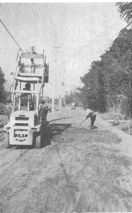
改修工事の進む西原線

柏市では、人口の増加にともない、郊外が次々と市街地化されていますが、これと平行して、市道の新設や改修も進められています。そのひとつとして、西原線の改修工事が行なわれていますが、この道路は、南江戸川台、萩の台など最近開発されている住宅地と、東守谷、流山線を経て幹線道路で十キロ、西原から江戸川台まで、総延長八百米のものを、中員八米に改修しようとするものです。このうち、八百五十米はすでに終わっていますが、未改修の約一キロ分として、この四百六十米の工事が残り、ひき続いて残りの部分も進められる予定になっています。この工事により、中員が狭がって、人も車も通りやすくなるほか、初石や江戸川台の駅へ出る便もぐっとよくなり、時間も短縮されることでしょう。