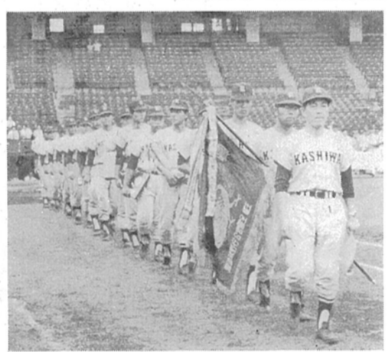
準優勝旗を手に後楽園のダイヤモンドを一周するナイン

去る九月三日から八日まで、後楽園球場で開催された、才十八回全国官公庁野球大会に千葉県代表として出場した柏市役所野球チームは、参加四十六代表に伍して、初出場ながら健闘し、見事準優勝の栄冠を飾りました。