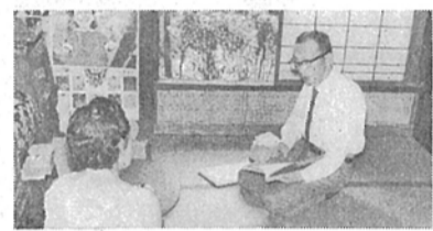
訪問相談する民生委員

柏市には、六十三名の民生(児童)委員があり、社会福祉増進のため、皆さんのよく相談相手になっています。 この方々は、民生委員法によって厚生大臣から委嘱され、社会福祉活動を進めています。皆さんの近所にも委員がおられます。