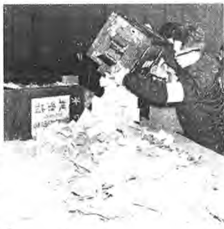
積みあげられる一票一票が政治を動かす力となる