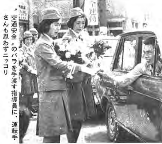
交通安全のバラを手渡す指導員に、運転手 さんと思わずニコリ