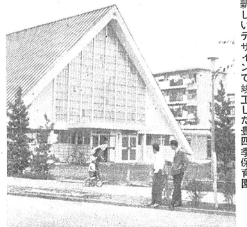
新しいデザインで竣工した豊四季保育園

市には、今まで保育園が五カ所ありましたが、六番目として豊四季団地に、豊四季保育園が開設されました。この保育園は、千九百七十五平方メートルの敷地に、コンクリート平家建ての管理棟、保育棟、プレイルームがあり、百八十人の園児を収容できます。保育には、保育室六、乳児室一、ほふく室一つがあり、一才児から五才児までの保育を七月十日から始めました。現在園児は百名です。また、入園を希望される方は、市役所福祉事務所へご相談ください。なお、保育園では、児童福祉法によって措置される子どもが保育されています。