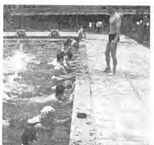
まずバタ足の練習から(水泳教室で)

七月五日の市政だよりでお知らせしたとおり、スポーツ教室が開かれます。 この教室は、教育委員会が体育協会や体育指導連絡協議会と協力して行なうもので、毎年おなじみのものです。 スポーツをやりたい人も機会がない人や、特定のスポーツを初歩からマスターしたいという人のためには絶好の機会です。 実施期間は七月から十一月までで、水泳、剣道、野球、民謡、フオーダンス、バレーボールの六種目ですが、七月から八月にかけて行なわれる種目は次のとおりです。ふるってご参加ください。 受講料は不要ですが、水泳教室の場合には実費百円が必要で水泳教室(東葛高校プール) 中学生以上、一般 七月二十六日~七月二十九日 八月八日~八月十六日(但し十二日を除く) 剣道教室(東葛高校・柏警察署) 小中高生・一般 七月二十一日~七月三十日 東葛高校・午前九時~十一時 柏警察署・午前六時~七時 午後六時~八時 庭球教室(千代田町電通コート) 小中高生・一般