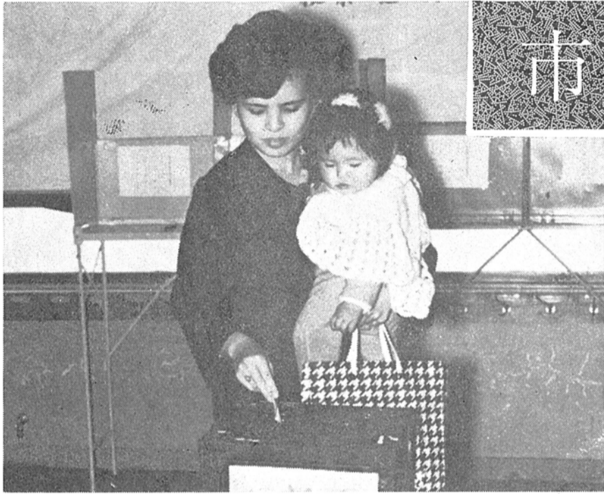
子どもの幸せを願ってこの一票を

この選挙の日程は、投票日が八月二十日となりますが、告示(立候補受付)は八月十日、立候補締切りが八月十三日午後五時となり、投票に必要な入場券は、七月二十五日まで、選挙管理委員会から発送され、選んでも八月五日閉まるといいます。選挙運動の期間は、告示から投票日の前日、八月十九日までの十日間です。