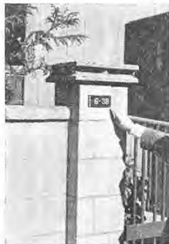
各戸に「住居番号表示板」

の職員がお伺いして取付けますが留守の時などは、ご近所におことわりして取付けさせていたたく場合もあるかと思っておりますので、あらかじめご了承願います。