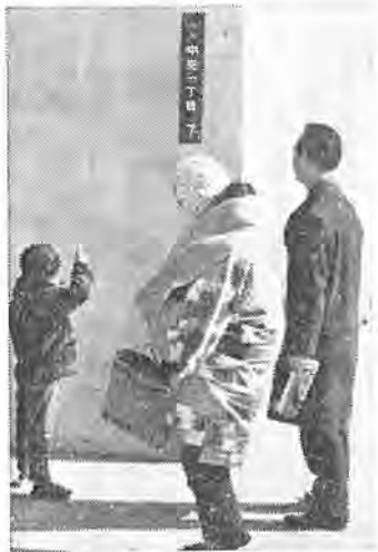
街角に「街区表示板」

(各戸の番号は、100台は階数を、その他は部屋番号を表わします。306号は、3階の6号ということです。又中高層建物で棟番号が順序よくついている場合は、団地の場合と同じです。)