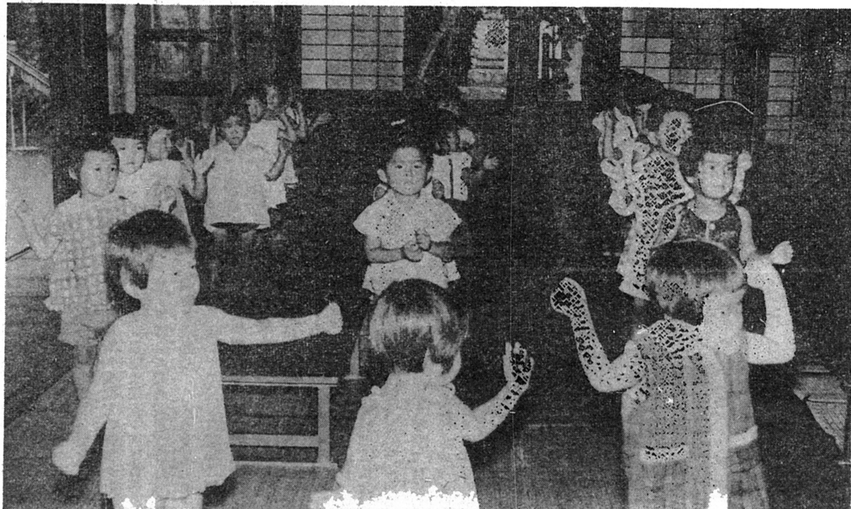
無心に遊ぶ子供たち (藤心宗寿寺にて)