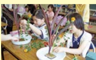
▲放課後子ども教室で生け花に挑戦する小学生

生涯学習課は、平成19年度に当時の社会教育課と青少年課が一つになって誕生しました。企画総務と振興の2担当で、市民の皆さんが「いつでも・どこでも・誰でもが・自分の意思で」取り組める学習活動の支援に取り組んでいます。