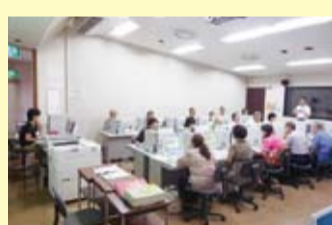
▲学習ボランティア向けに行われた研修会

振興担当で実施する放課後子ども教室では、小学生が地域のアドバイザーのサポートにより、生け花や工作などの体験活動や補充学習を行っています。学校ではなかなか経験できないラインアップが好評です。また、新成人のつどいでは、新成人で組織される実行委員会を事務局としてサポートしています。昨年度は市内で3,643人が成人を迎え、実行委員のかたは「地元で忘れられない貴重な思い出ができた」などと語ってくれました。