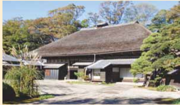
かやぶき屋根の主屋

旧吉田家住宅歴史公園は、花野井で大規模な農業や醤油(しょうゆ)醸造業を営みながら代々名主の役を務め、江戸幕府の牧場管理にも携わっていた吉田家の貴重な建物を見学できる歴史公園です。