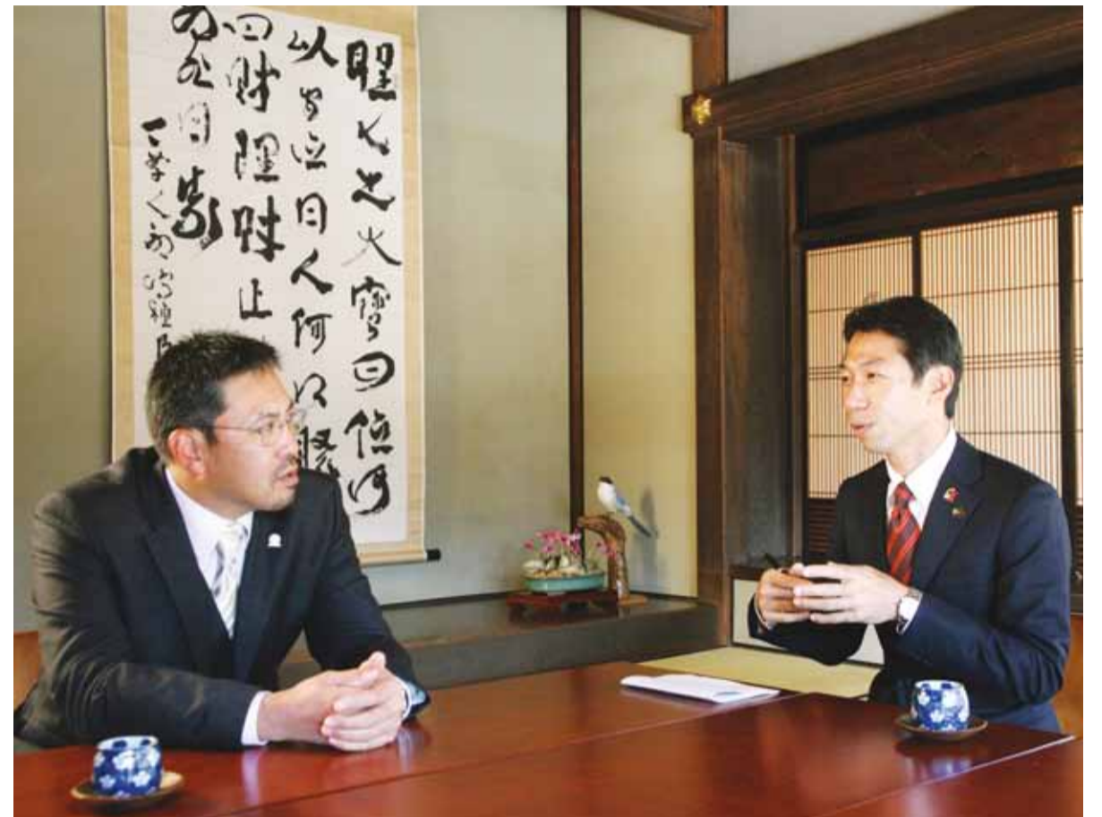
旧吉田家住宅・書院での対談の様子