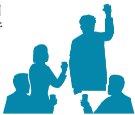
表1 地域の歴史を学ぼうコース