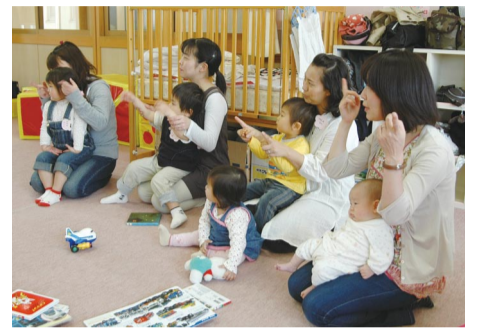
富勢保育園らっこルームでのサークル活動

楽しいけれど悩みも多い子育て。市では、子育て中のかたのために、一時保育や地域子育て支援センター、ふれあい保育など、さまざまな事業を行っています。仲間づくりや情報交換のために、参加してみませんか。