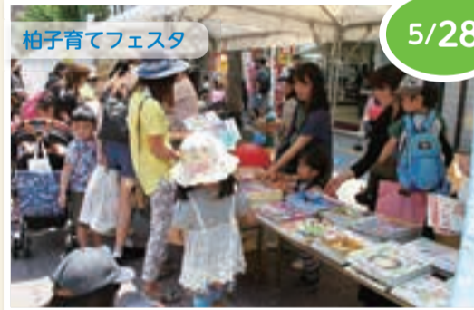
▲さまざまな団体の発表や模擬店など、多世代で交流できるイベントです