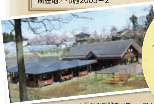
▲既存の施設をリニューアルしました

農家食堂では、野菜を主役にしたカレーやサンドイッチなどがおすすめ!ベジQでは、自分で採って焼くという新感覚のバーベキューを体験できます。収穫体験なしの材料付きプランや持ち込みプランもあるので、お気軽にお越しください