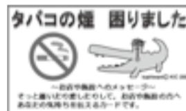
▲タバコの煙困りましたカード

配布場所/市役所本庁舎1階受付、柏駅前行政サービスセンター、ウェルネス柏、母子保健コーナー(市役所別館3階)、健康相談コーナー(沼南庁舎1階)など