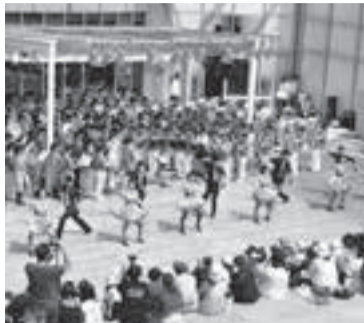
▲昨年の市立柏高等学校吹奏楽部の様子