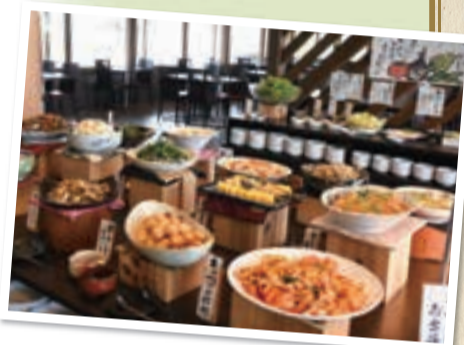
▲肉や魚を使っていないのに、飽きのこない食べごたえあるメニューが魅力

☎11:00~15:00(ラストオーダー14:00) 定休日/水曜日(祝日は営業) 所在地/高田100