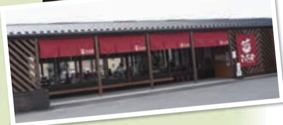
▲「農産物直売所かしわで」に隣接しています

お店のシェフである農家の主婦が、本当においしいメニューを提供すべく、全国各地を食歩き研究に研究を重ねてメニューを考案。料理から飲み物まで、地元農産物を使ったこだわりメニューをビュッフェスタイルで楽しめます。