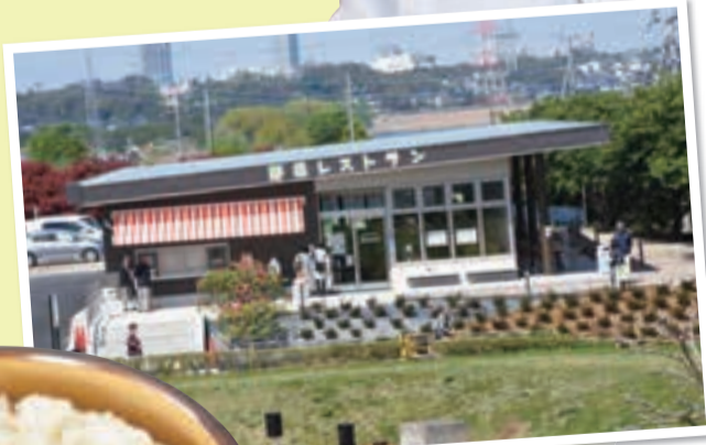
▲手賀沼沿いにあり、眺めは抜群!

料理長は元銀座のアジアン創作料理店のシェフ。素材を生かした料理を手賀沼の景色を見ながら楽しめます。また、ドリンクやソフトクリームなど、テイクアウト用のメニューもあるので、手賀沼周辺のサイクリングやお散歩の休憩にも最適です!