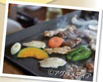
▲ベジQの収穫体験では、おいしい野菜の見分け方等を学べるので食育にも最適!採れたて野菜の味は格別です