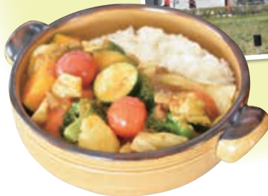
◀彩りにもこだわった野菜たっぷりのカレー