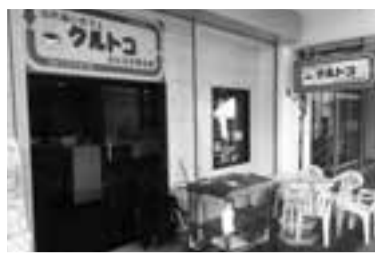
▲市内2例目として大津ケ丘にオープンした「ふれあいカフェ クルトコ」