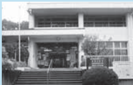
▲南部近隣センター

施設の長期にわたる有効利用を図るために、近隣センターの機能の再検討を実施します。今年度は南部近隣センターをモデル施設とし、地域のかたがたと社会情勢や市民ニーズに対応した機能の整理・見直しなどを検討していきます。