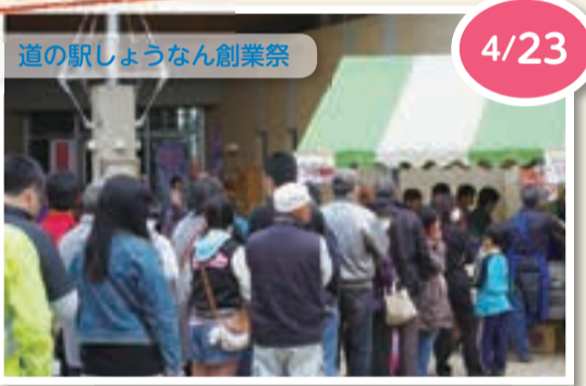
▲新鮮な旬の野菜を楽しめるイベントです