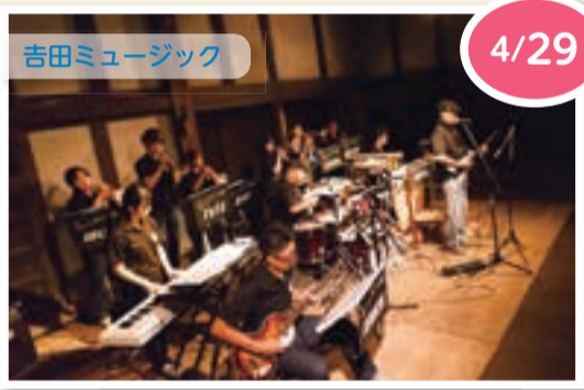
▲非日常的な空間で行われるライブは、旧吉田家住宅の新たな魅力に