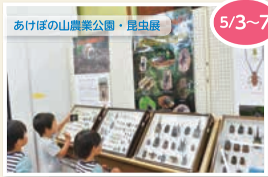
▲世界中の昆虫標本を見ることができます