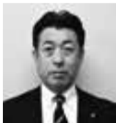
副市長 鬼沢 徹雄(新任)