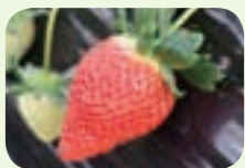
▲千葉県発のチーバベリー

千葉県農林総合研究センターでは、新品種「チーバベリー」を開発。1月から県内のイチゴ園や直売所で販売が開始されました。チーバベリーは、他の品種と比べて大ぶりで、鮮やかな色合いやバランスの良い形が特徴。食べるとジューシーな食感で、甘味の中にも程よい酸味が感じられます。市内でもチーバベリーを取り扱っているイチゴ園があります。