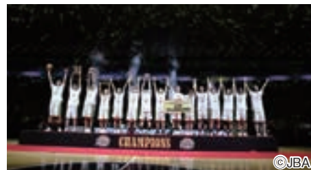
▲4年連続日本一、おめでとう!