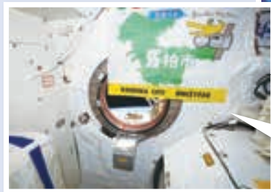
▲国際宇宙ステーション「きぼう」で撮影された窓からのぞく地球と掲げられた旗