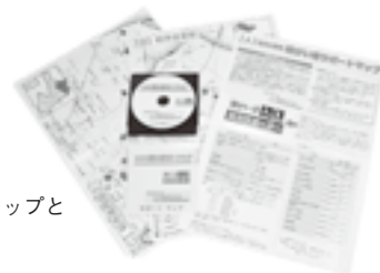
▶災害時サポートマップと音声版(CD)

取得方法/▶点字版=障害福祉課へ電話で▶音声版(CD)=障害福祉課(市役所別館2階)で配布