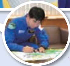
▲旗にサインをいただきました