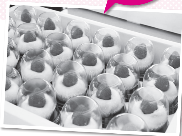
▲イベント限定のイチゴがまるごと入った大福

各直売所では、イチゴだけではなく、ジャムやお菓子など農家のかたたちが工夫を凝らした加工品も販売されています。