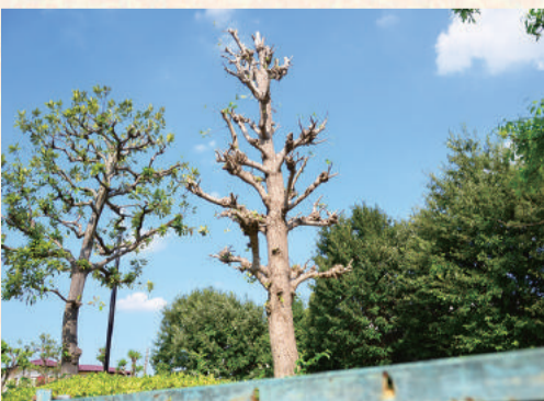
▲強剪定をした公園の樹木