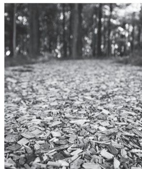
▲舗装材をまいた増尾城址公園の園路

伐採した樹木は、木材粉砕機でチップ状にして園内にまくことで、舗装材や雑草抑制剤として利用しています。