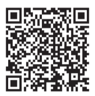
▲ガイドブックはスマホでも

配布場所/行政資料室(市役所本庁舎1階)、各近隣センター、県立柏の葉公園、かしわインフォメーションセンター(柏駅南口ファミリかしわ3階)、柏市みどりの基金(北柏ふるさと公園内)