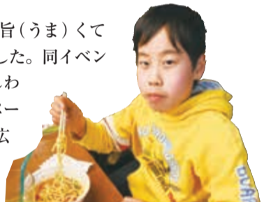
▲柏のカブを使ったパスタは辛いけどおいしい!

春の足音が近づく3月19日、音楽ライブと柏の「旨(うま)くて辛い」限定グルメ試食会のイベントが開催されました。同イベントは、柏の一大音楽イベント「音街かしわ」とかしわインフォメーションセンターが発行するフリーペーパー「カシワトカ。」のコラボレーション企画。幅広い世代の人々が参加し、カレーパン・エビの豆乳スープ・スパゲッティ・激辛たこ焼きなど、市内飲食店の限定旨辛グルメを堪能しました。ライブでは、女性歌手グループ「花*花」が、来場者から募った柏のおすすめデートスポットに歌詞を変えた曲を披露し、なじみの地名に会場も大盛り上がり。夫婦で来場していた女性は「次回はぜひスイーツ版でも開催してほしい」と話してくれました。新たな企画にも期待が高まります。