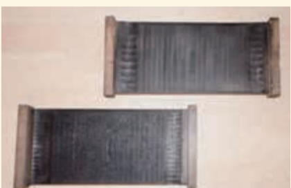
▲金陵の論考などを集めた「金陵遺稿集」の版木

「欧米列強のうち、アメリカは南北戦争の渦中にある。ロシアとオランダは日本には手を出さないであろう。従ってわが国が真剣に対策を立てるべきはイギリス・フランスである」