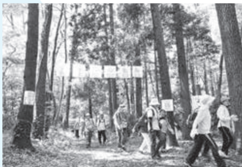
▲今年もカシニワを体感できるイベントが満載

☎4月28日(木)午後5時までに住所・氏名・電話番号・希望コース名を書いて、〒277-0001呼塚新田204-2 柏市みどりの基金へ郵送(必着)するか、✉midori-k@fancy.ocn.ne.jpで※1人1コース2席まで。応募者多数の場合は抽選