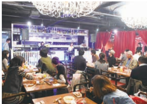
▶市民なじみの公園が歌詞に登場