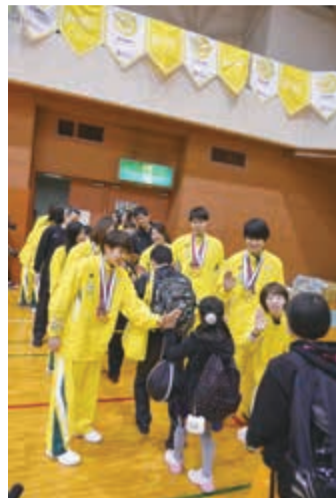
▲最後はハイタッチでファンを見送り