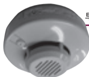
早期発見に役立つ住宅用火災警報器

11月9日(日)～15日(土)に、「火のしまつ 君がしなくて誰かを守る」をスローガンに、秋季柏市火災予防運動を行います。 火災予防には一人ひとりの心がけが大切です。この機会に、火災予防に関心を持ち、火の元を確かめて、火災の発生を未然に防ぎましょう。 平成20年9月までに、市内で百五件の火災が発生し、今年も昨年の同時期に比べ火災件数が減少している状況です。火災予防運動を前に11月6日(木)午前11時から柏駅東口サンサン広場で消防音楽隊のコンサートと住宅用火災警報器の展示と相談を行います。また、11月3日(月)そごう柏店八階連絡通路で「児童防火ポスター展」を行います。この機会にぜひご覧ください。