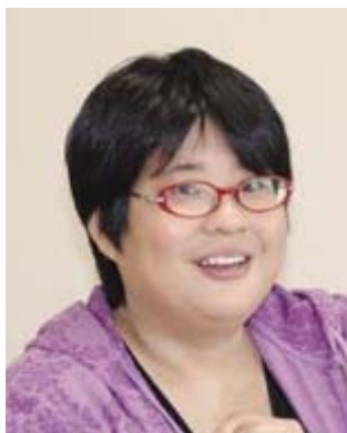
アメリカの大会で優勝