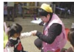
絵を通じて楽しんでもらう

豊住在住。35歳。「音街かしわ野外ライブ2008(2面参照)」に出演予定、300円～。