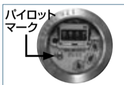
パイロットマークで漏水の確認

また前回に比べて急に使用量が増えた場合、地下や床下など見えないところで、水が漏れていることがあります。家中の蛇口を全部締め、メーターのパイロットマーク(別掲参照)を確認してください。少しでも回っていたら漏水の可能性があり、柏市管工事