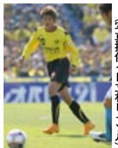
闘志溢れるプレー

家族思いで、時間を見つけては実家に戻る。「父親からは今でもサッカーのアドバイスを受けるし、母親には人生のことを教えてもらっています」。