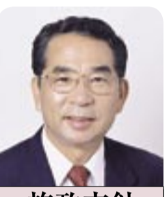
施政方針 柏市長 本多 晃