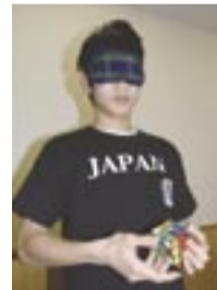
大会の時に着たTシャツで、目隠し競技を再現

らは想像できないほど鮮やかな手つきで、見る間にすべての色がそろっていく。好きな教科は数学。普段の練習でも、パソコンを駆使してランダムにキューブを崩し、タイムを計る。「始めたころは、気が向いたときにやるだけだった」ルービックキューブも今では毎日数時間。「努力」というよりは、好きなことを好きなだけ、興味にまかせてやってきた結果が、世界だったという感じだ。「自分をきっかけにほかの人がルービックキューブを始めてくれたり、キューブをきっかけに友達が増えたりするのがうれしい」と表情は明るい。「また大会に出たい」と、名前の通り、可能性と夢は雄大に広がる。