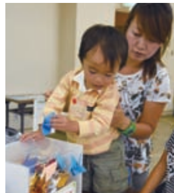
▲折り鶴に思いを込めて