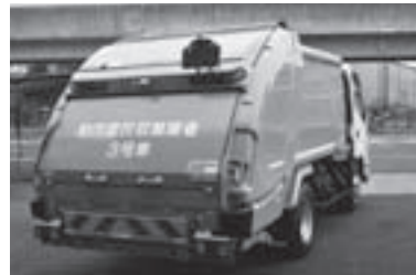
▲収集車の色は黄緑色(市直営収集車は青色)

今までどおり収集日当日の朝、午前8時30分までに出してください(収集時間が変わる場合もあります)。