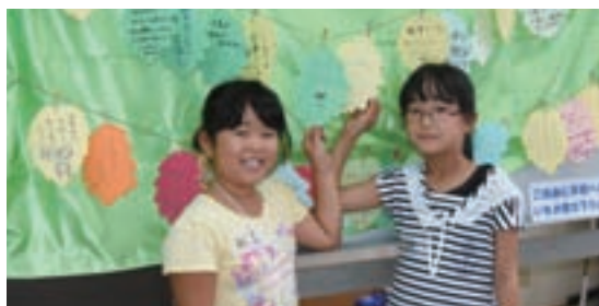
▲「世界の平和」を葉っぱにつづる