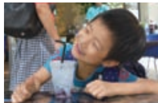
▲宇宙をモチーフにしたドリンクは甘くておいしい!