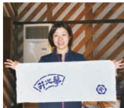
▲すてきな手拭いが完成!