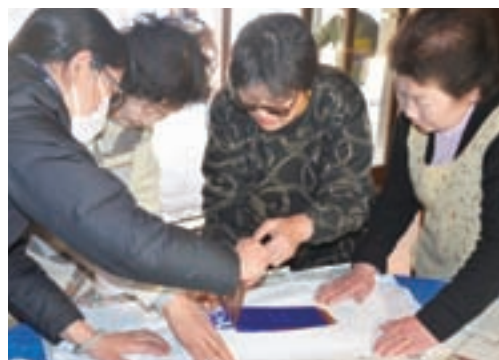
▲型紙を剥がすのに周りのかたも協力