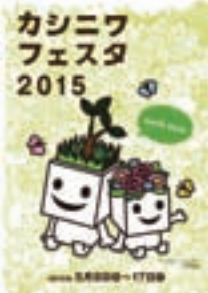
▲ガイドブックの配布は 無くなり次第終了