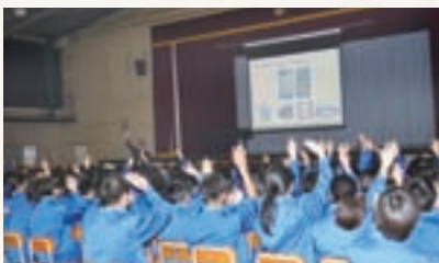
▲スマートフォン安全教室で「LINEをやっている人」に挙手する生徒

春の新生活を機に増えるのが、卒業写真や友達の写真を勝手に第三者に送信したり、インターネット上に投稿したりする画像トラブルです。いじめなどの原因になるだけでなく、写真には撮影日や位置などの情報が含まれていることがあるため、最悪の場合、ストーカーなどの犯罪に巻き込まれることもあります。子どもをトラブルの被害者や加害者にならないために、親がその危険性を理解し、正しい知識を持つことが大切です。子どもに携帯電話やスマートフォンを持たせる場合は、次のことを行ってください。