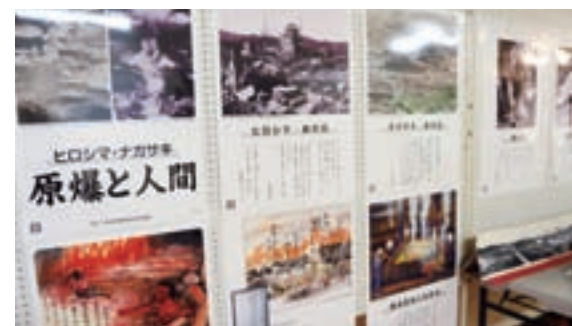
▲当時の様子が分かるパネル展も開催