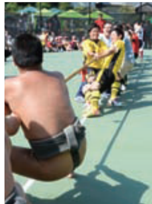
▲大迫力の綱引き合戦