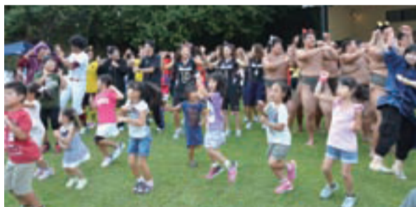
▲みんなでAKB48「恋するフォーチュンクッキー」を踊りました

好天に恵まれた9月23日、吉田記念テニス研修センター(花野井)ではスポーツイベントが開催され、約2,500人が来場しました。ホームタウンチーム等によるスポーツ教室のほか、音楽ステージや多数の屋台も並び、まるでお祭りのようににぎわいに。また、創部3年目にして、全国大会や世界大会で活躍する柏日体高校相撲部が初参加し、子どもたちやホームタウンチームの選手と相撲取組や綱引き合戦をして会場を沸かせました。同部員も「たくさんの笑顔や応援がこれからの練習の励みになります」と話してくれました。締めくくりはみんなでダンス!会場は一体感に包まれていました。