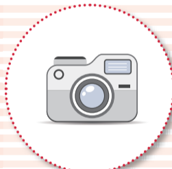
デジタルカメラ・ デジタルビデオカメラ