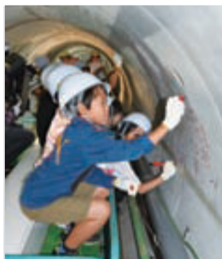
▲楽しいイラストや感謝のメッセージも

メットと軍手を装着。地下約10メートルの深さまで降り、特別仕立てのトロッコ列車に乗り込んで、直径1.8メートルのトンネル探検にいざ出発!およそ300メートルの長さを時速2~3キロメートルのスピードで走るトロッコ列車に、子どもたちは「思ったよりスピードが速くてびっくり。中はひんやりして寒かった」と大はしゃぎ。見学の最後には、トンネルの壁に思い思いのメッセージやイラストなどを書いてい