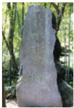
▲地名の由来を刻む開墾碑(十余二皇大神社)

柏市とその周辺の地図をしてみると、数字にちなんだ地名が目につきます。1番目の初富(現・鎌ヶ谷市)から13番目の十余三(現・成田市)まで13カ所あり、このうち4番目の豊四季と12番目の十余二は柏市に位置し、市内でも特に変貌の著しい地域となっています。今回は、柏市発展の原点ともいえる豊四季と十余二の成り立ちについて紹介します。