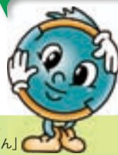
▶柏市ゴミ減量マスコット キャラクター「クリンちゃん」

市では、これまで旧柏地域で不燃ごみ、旧沼南地域で資源ごみとして排出されていた使用済み小型家電を、11月4日(火)から専用のボックスで回収することになりました。回収された小型家電は分解・破砕ののち再資源化され、新しい家電などの原材料として再生利用されます。この事業は、旧柏地域、旧沼南地域ともに同じ回収方法で実施します。