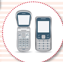
携帯電話・PHS・ 電話・FAX

◎対象品目についての詳細は、市のホームページか10月31日(金)の朝刊に折り込まれるチラシをご覧ください