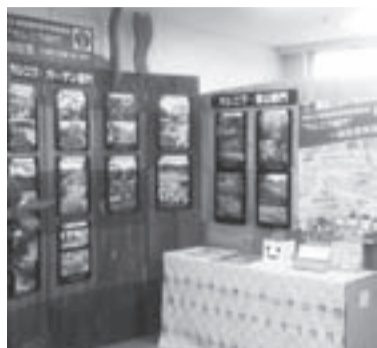
▲昨年の投票会場の様子