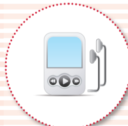
携帯音楽プレーヤー・ ICレコーダー