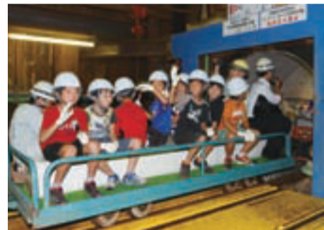
▲トンネル探検号が出発

市では、大雨などによる浸水被害の対策として、地中にトンネルを掘り、雨水管を整備しています。普段見ることのできない下水道の世界を知ってもらおうと、9月18日に豊四季地区の工事現場で見学会を開き、豊小学校4年生と地域のかた約200人が参加しました。浸水対策についてのビデオを見た後、ヘル