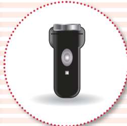
電気カミソリ・電子体温計・ 電動歯ブラシ