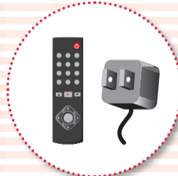
付属品 (リモコン・ ACアダプタ・充電器など)