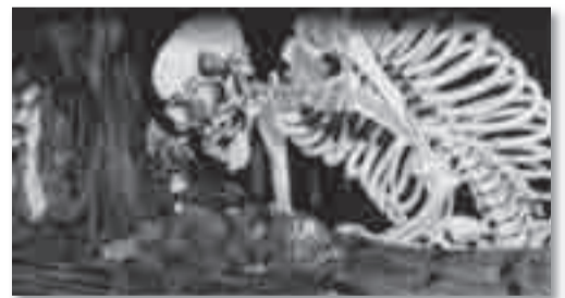
▲歌川国芳「相馬の古内裏」

平将門の怨霊や、ものゝけが描かれた絵巻などを通して、幽霊画・妖怪画の魅力を紹介。この夏、展示室に涼みに来ませんか。お子さんの夏休みの宿題にも役立つかも知れません。