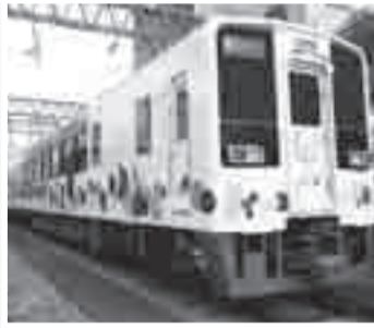
▲スカイツリートレイン