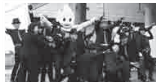
▲ファミリーかしわ前広場には、おなじみダンスも登場予定!