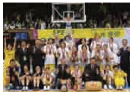
▲皇后杯との2冠達成!