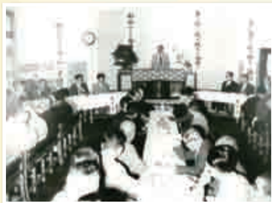
▲四カ町村の議員による合併促進大会

を議決。11月1日に富勢村を廃し、大字弁天下・宿連寺・松ヶ崎新田・柏堀之内新田と根戸・根戸新田・呼塚新田・布施の各一部区域を東葛市に、その他の区域を我孫子町に編入しました。そして11月15日、市の名称変更に関する条例により東葛市の名称が変更され、柏市が誕生しました。