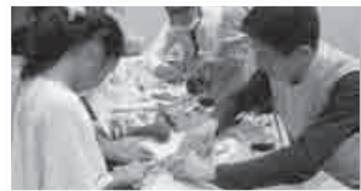
▲体験コーナー「おもちゃ工作教室」

◎台紙はダブルデッキ上の総合案内所・柏市民活動センター・アミュゼ柏等で配布します