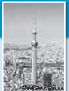
▲東京スカイツリー