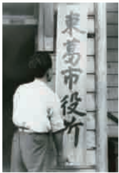
▲掲げられる「東葛市役所」の看板