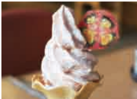
▲ドライトマトのチップスが特徴的です

平成13年4月20日にオープンし、今年14年目を迎えた道の駅しょうなんの来場者が1,500万人を突破しました。これを記念して、新作ソフトクリームを期間限定で販売しています。これまで道の駅しょうなんでは、梨やカブなど柏産の農産物を使用した4種類のソフトクリームを販売し、人気を博してきました。そして、第5弾の今回はなんとトマト味! 1個350円で6月30日(月)まで販売される予定です。気になるその味は、ぜひ道の駅しょうなんでお確かめください!