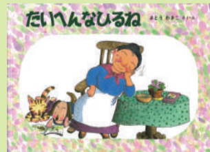
▲「たいへんなひるね」1988年 福音館書店©Wakiko Sato