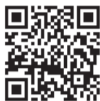
▲ふるさとチョイスはこちらから