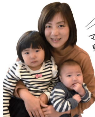
ママの 息抜きになる おしゃべり会や 講座で応援♥

1人で子育てをしていた時期は、かわいいはずのわが子でも家に2人きりでこもっているのがつらく、追い詰められていました。そんな時、助けてくれたのはママ友の存在。1人で悩んでいるママは多く、「他のママたちに私と同じような大変な思いをしてほしくない」と考えるようになり、サークル活動を始めました。企画を考えるのはとても楽しく、仕事に復帰してもこの活動は続けていきたいと思っています。柏には子育てを応援する団体やイベント、場所がたくさんあるのに、知らないのは本当にもったいない! サークル活動を通じてみんなに知らせていきたいです。