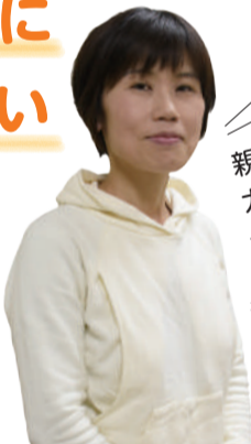
親子の集まる カフェや 一時保育で 応援★

心をオープンに、思い切って地域に飛び出してみませんか? あなたにとって、心が上向きになるきっかけがあるかもしれません。あなたが来るのを待っています!