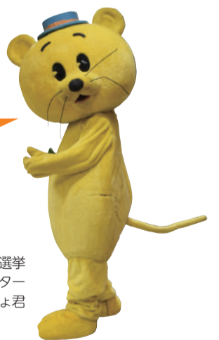
千葉県明るい選挙 シンボルキャラクター せんきよ君

投票日に仕事や旅行などの予定があるあなた！ 期日前投票に行こう。 投票所整理券を忘れてしまっても大丈夫！