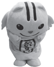
明るい選挙 キャラクター 選挙の めいすいくん

大切な一票を 無駄にしないで！ みんなで声を掛け合って、 さあ、W投票に 行ってよう！