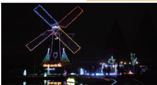
▲水面に映るイルミネーションが幻想的な雰囲気演出します