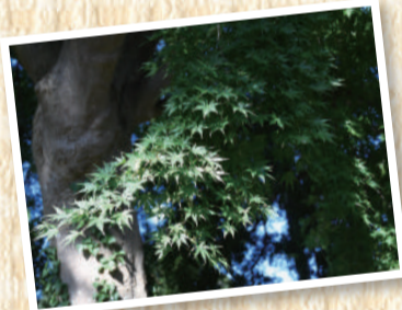
◀11月に入り少しずつ色付き始めました

県道8号線から少し入ったところに10本のカエデが立ち並びます。その年により色付き方もさまざまなようです。今年はどんな色を見せてくれるのでしょうか。