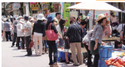
▲毎年多くのかたでにぎわうフリーマーケット。掘り出し物を探しに、ぜひお越しください