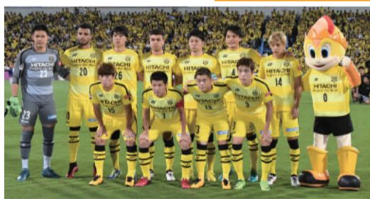
▲12月2日(出)はJリーグホーム最終戦! 日立台で選手に熱い声援を届け、有終の美を見届けよう!