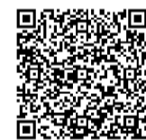
▲柏・愛らぶ基金寄付の方法

申込方法 ／協働推進課(市役所本庁舎3階)・各近隣センター・市民活動サポートコーナー(パレット柏)で配布しているパンフレットに添付された「寄付申出書」に必要事項を書いて、柏市役所協働推進課へ郵送で※切手不要。市のホームページから応募も可。後日、納付書を送付します。指定金融機関からお振り込みください