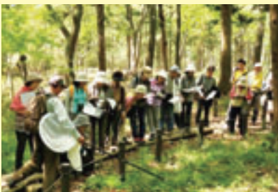
▲こんぶくろ池公園で行われる自然観察会

私が所属する公園緑政課では、そんな街の緑を「守り、つくり、育てる」ことを目標に、里山保全活動の担い手づくりや、新しい公園の計画・整備、緑のオープンスペースの確保、ボランティア団体への支援など、緑に関する多様な業務に取り組んでいます。