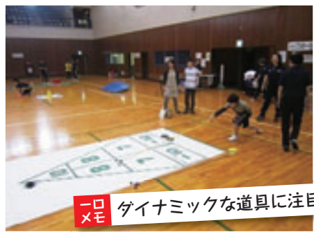
ダイナミックな道具に注目

「キュー」と呼ばれる細長い棒を使って円盤を押し出し、得点エリアに向かってシュートします。円盤が止まった場所によって得点が決まり、獲得した点数を競います。