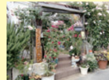
▲カシニワ制度に登録のオープンガーデンは現在約40件

また、本紙5月1日号でお知らせしましたが、地域全体で共有できる緑を増やして街全体を緑に囲まれたガーデンにするためカシニワ制度を推進しており、今週末には「カシニワ・フェスタ」を開催します。5月18日(土)~20日(月)の3日間、市内各所のカシニワ登録地などが一斉公開されますので、皆さんぜひマップを片手にカシニワ巡りをしてみてはいかがでしょうか。きっと、「市内にこんなに緑があったんだ」と、新しい発見があると思います。