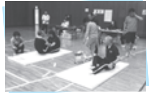
▲上体起こしでの一幕

スポーツ推進委員による「新体力テスト」を行います。今後のスポーツ活動の参考にするため、実年齢と体力年齢の差を確認してみませんか。