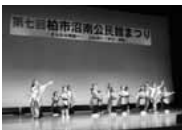
▲昨年行われた「創作ダンス」の様子