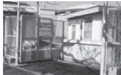
▲第五水源地に設置された応急給水設備