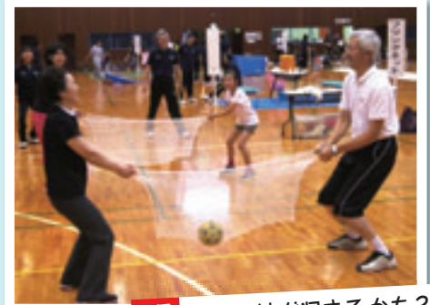
親子の絆が深まるかも?

2人以上で楽しむゲーム。大きなネットの反動を使って、ボールを落とさないように他のグループに渡したり、受け取ったりします。