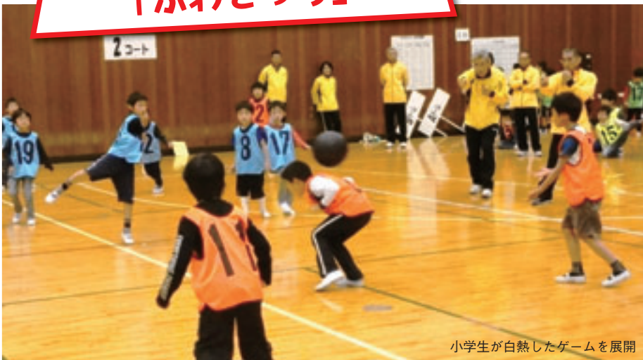
小学生が白熱したゲームを展開

皆さんは「ふわどっち」をご存じですか? これは、バレーボールの製造途中にできるボールを使ったドッジボールです。外側に革を張っていない、柔らかくてふわふわしたボールなので、当たっても痛くありません。平成19年に、柏市スポーツ推進委員(旧体育指導委員)協議会と市が考案しました。「ふわふわしていて当たっても痛くない」「柔らかいから投げるとどっちに飛んでいくか分からない」などの特徴から、その名が付けられました。一人でも多く、柏の「ふわどっち」人口が増えていくといいですね。