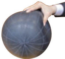
柔らかさが特徴の ふわどっちのボール

皆さんは「ふわどっち」をご存じですか? これは、バレーボールの製造途中にできるボールを使ったドッジボールです。外側に革を張っていない、柔らかくてふわふわしたボールなので、当たっても痛くありません。平成19年に、柏市スポーツ推進委員(旧体育指導委員)協議会と市が考案しました。「ふわふわしていて当たっても痛くない」「柔らかいから投げるとどっちに飛んでいくか分からない」などの特徴から、その名が付けられました。一人でも多く、柏の「ふわどっち」人口が増えていくといいですね。