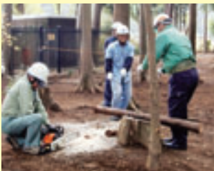
▲毎年秋に行われる里山ボランティア入門講座

公園緑政課で仕事をしていると、柏の緑を守り、つくり、育てているのは、行政だけではなく、緑に関わる市民のかたたちの力が非常に大きいことに気付かされます。これからも市民や企業などと協力して、まち全体が一体となって柏の緑を育てていけるよう頑張ります。