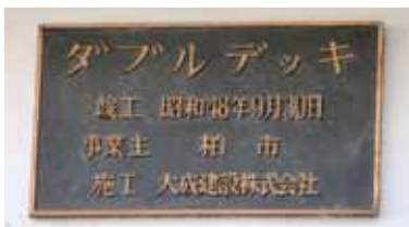
ダブルデッキの橋名板

なお、広場の機能を持たない歩行者専用通路のデッキも含む「ペDESTリアンデッキ」としては、「日本で初めて」は、正確ではないと考えられます。