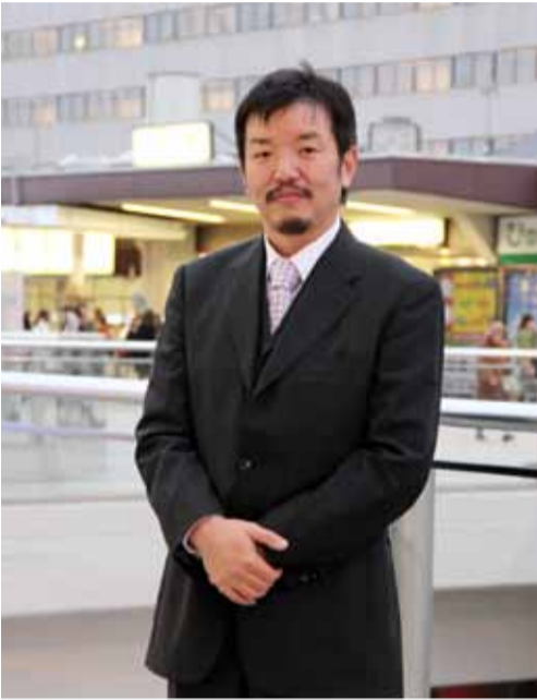
JOBANアートラインかしわ実行委員会の実行委員長。柏ソーシャルキャピタル協会理事長。柏の街づくりと活性化に取り組む。

「より洗練されたデザインにしたい」という思いから、ドキドキしながら話し合いの場で意見した。「柄にもないことをした」が、出来上がりには大満足。これがいよいよきっかけとなった。 これまでは、偶然アートと出くわす楽しさを柏の新しい文化にしようと活動し、地域活性化に取り組んできた。リニューアルが進