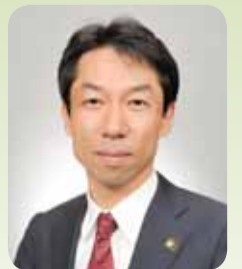
柏市長 秋山 浩保