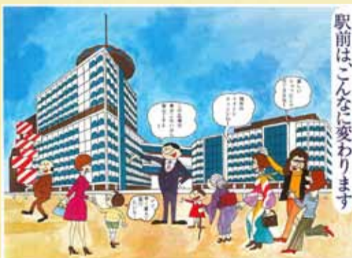
夢に満ちた本紙昭和48年1月1日号の表紙イラスト