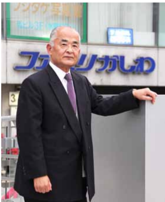
柏駅前第一商業協同組合顧問。昭和42年柏市役所入庁。昭和46年、再開発事業を担当。昭和48年4月に退職し、同組合の事務局長へ。専務理事を経て現在に至る。

「柏が力を付けるための(今日までの)貯金だったのではないかと、当時の再開発を振り返る。「その貯金も使い果たして、陳腐化する寸前だった。今回のリニューアルで新たな貯金が用意さ