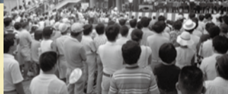
昭和53年の柏まつりでのステージ