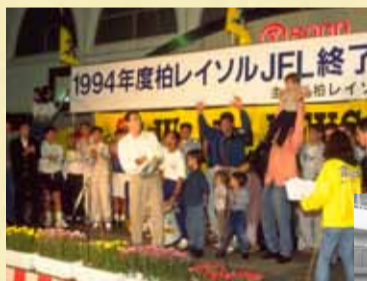
デッキの上でJ1昇格を喜ぶ選手たち