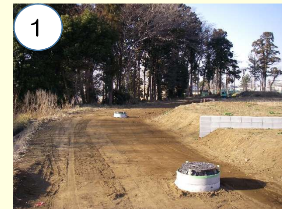
宅地造成が進み、道路と宅地の位置がわかるようになりました。

工事風景の一部です。 写真番号は左図中の番号の位置です。(矢印方向へ撮影したもの)