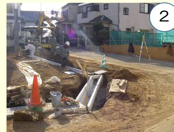
道路の拡幅に伴い、側溝を布設しています。