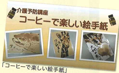
「コーヒーで楽しい絵手紙」