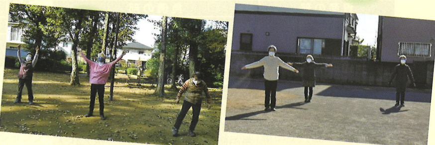
光ヶ丘地域での活動の様子

人と人とのつながりを切らさないためのお手伝いをしたいとの思いから、屋外で実施できる「体操講座」を複数回にわたり、地域のサロンと協力して開催しました。この集まりをきっかけに、地域のみなさんを中心とした、ミニ講座やレクリエーション、情報交換会等のオリジナルの活動がスタートしました。現在も、工夫した活動が継続しています。