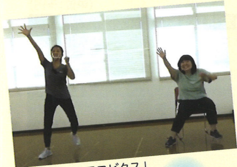
「やさしいエアロビクス」