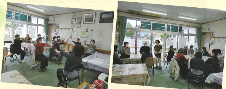
風早南部地域での活動の様子

「顔を合わせようの会」を10月15日、22日、29日の3回にわたり、地域の居場所活動者と協力して開催しました。心身をほぐす体操とおしゃべりを楽しみ、「今後もこういった機会を持ちたい」という前向きな声をいただきました。