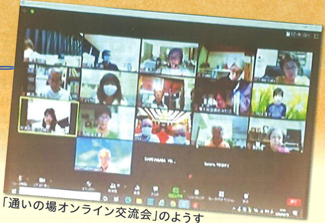
「通いの場オンライン交流会」の様子

令和2年7月から10月にかけて、「通いの場オンライン交流会」を開催しました。各団体の取り組みや事例を共有することで、屋外での活動やポスティングといった、新たな「つながり」が広がりました。