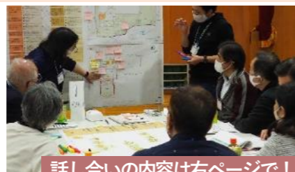
話し合いの内容は右ページで！

さらに、新しい高田近隣センターに導入すべき機能について話し合いを行いました。話し合いでは、用意された図面に直接書き込むなど、具体的な検討が行われました。