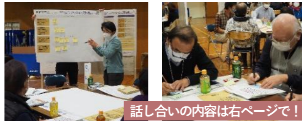
話し合いの内容は右ページで！

前回のワークショップをふまえて、事務局から「リノベーションの方向性(案)」が示されました。各班で方向性の内容についての確認を行いました。