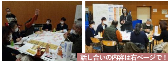
話し合いの内容は右ページで！

次に、リノベーションの方向性を実現するために、どの様な改善が必要であるかを話し合いました。