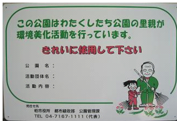
アダプトサインボード

A 12－希望する団体には、下図のようにその公園で環境美化活動を行なっていることをPRするアダプトサインとしての看板を設置します。