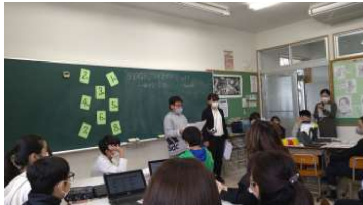
SDGsマイスターになろう ～伝えよう家族へ～