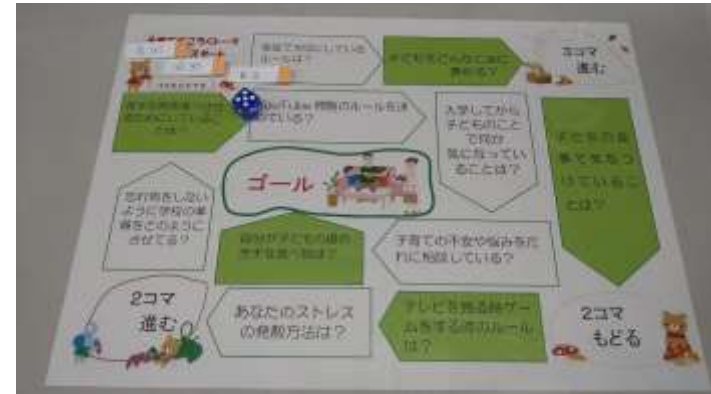
すごろくトーク (マス・サイコロ・駒)