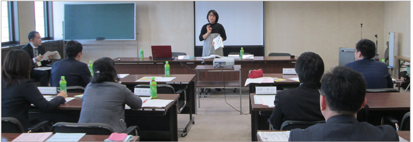
▲各委員が授業の中で実践した消費者教育報告会の様子(沼南支所501会議室にて)