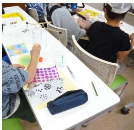
天びんはかりの工作