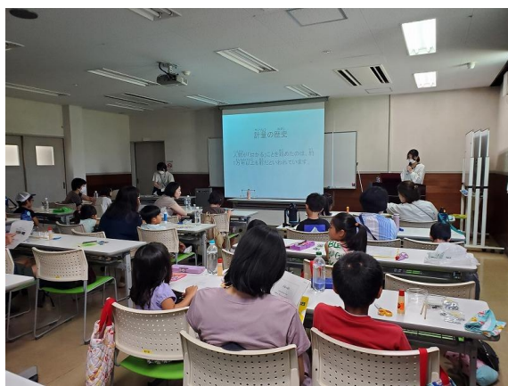
計量の仕事の講義