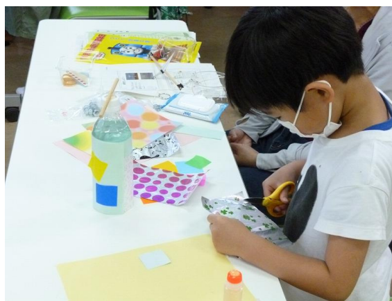
天びんはかりの工作