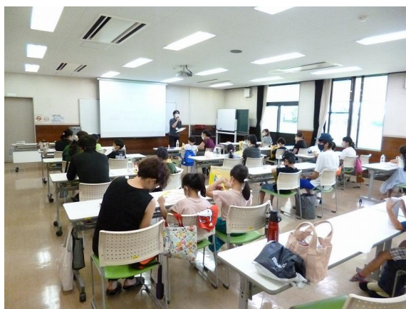
計量の仕事の講義