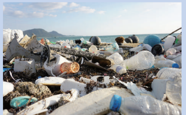
▲海辺に打ち上げられた大量のプラスチックごみ

軽くて丈夫で大量生産がしやすいといった長所があり、とても利便性の高い素材であるプラスチック。しかし、近年その使用量が増加したことで、海洋プラスチックごみやCO 2 （二酸化炭素）排出量が増加するなど、社会的にさまざまな問題が起きています。