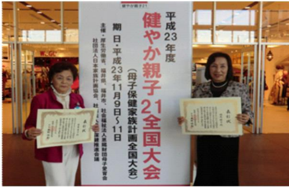
2011 (H23) 健やか親子21全国大会 (福井県)