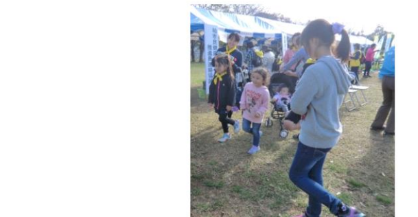
2015 (H27) 手賀沼ふれあいウォーク 2ステップテスト 開眼片足立ちテスト