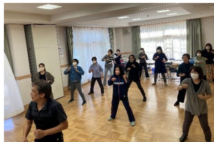
転倒予防 健康ソーラン節