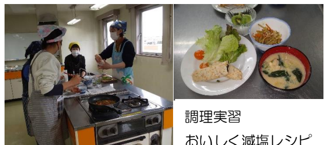
調理実習 おいしく減塩レシピ