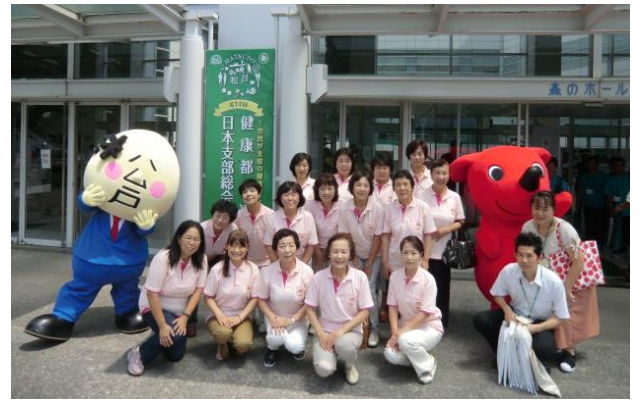
2018 (H30) 第14回健康都市連合日本支部大会 (松戸市 森のホール21)