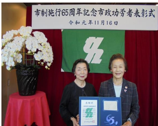
2019 (R1) 市政施行65周年記念市政功労者表彰式 柏市民健康づくり推進員連絡協議会が 団体表彰受賞