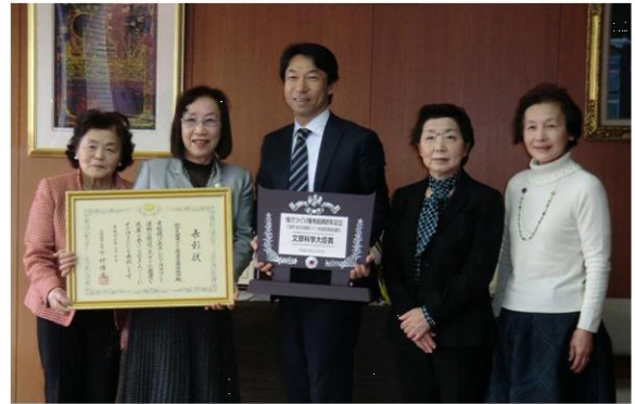
2013 (H25) 生涯スポーツ体カづくり全国会議 体カづくり優秀組織表彰文部科学大臣賞受賞