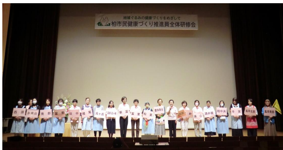
令和5年度 全体研修会