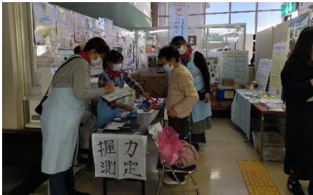
近隣センターまつり