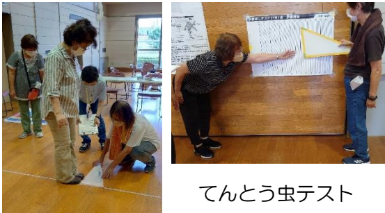
てんとう虫テスト