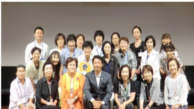
2014 (H26) 第10回健康都市連合日本支部大会 (我孫子市)