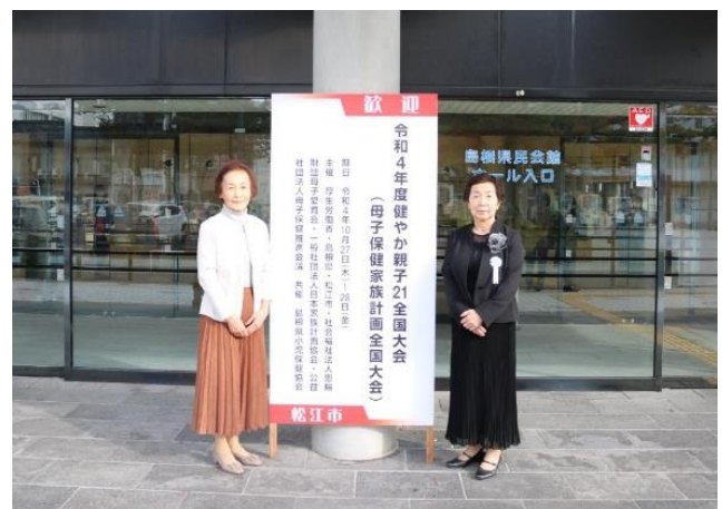
2022 (R4) 令和4年度健やか親子21全国大会 (島根県松江市)