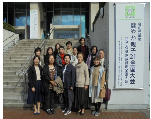
2019 (R1) 令和元年度 健やか親子21全国大会 (千葉市民会館)