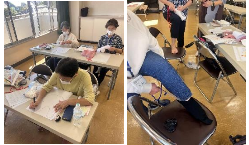
手作りのソックスエイド