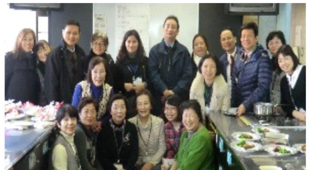
2015 (H27) NGO 健康都市活動支援機構・国際交流 (東南アジア諸国) (アミュゼ柏調理室)