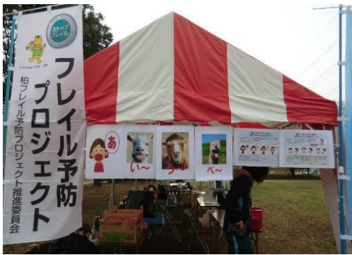
2017 (H29) 手賀沼ふれあいウォーク